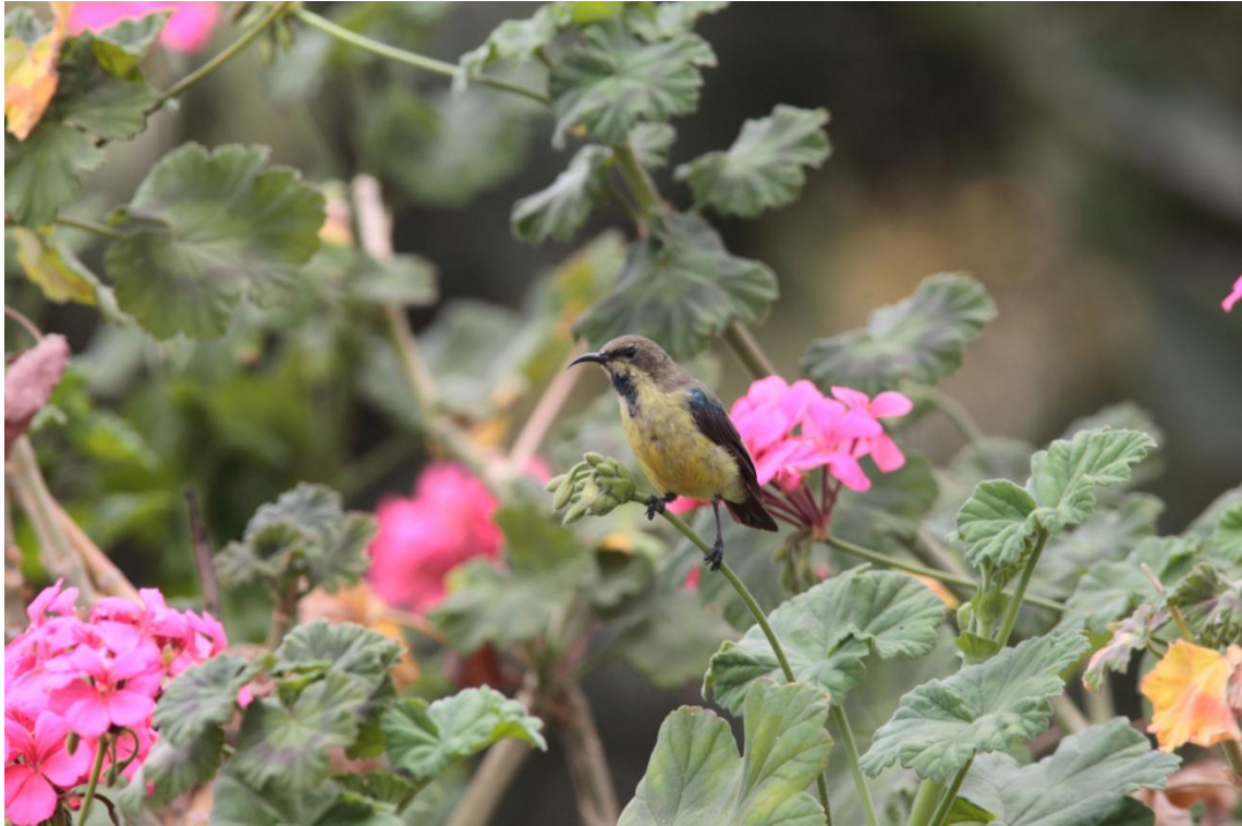
Variable Sunbird, Souimanga à ventre jaune