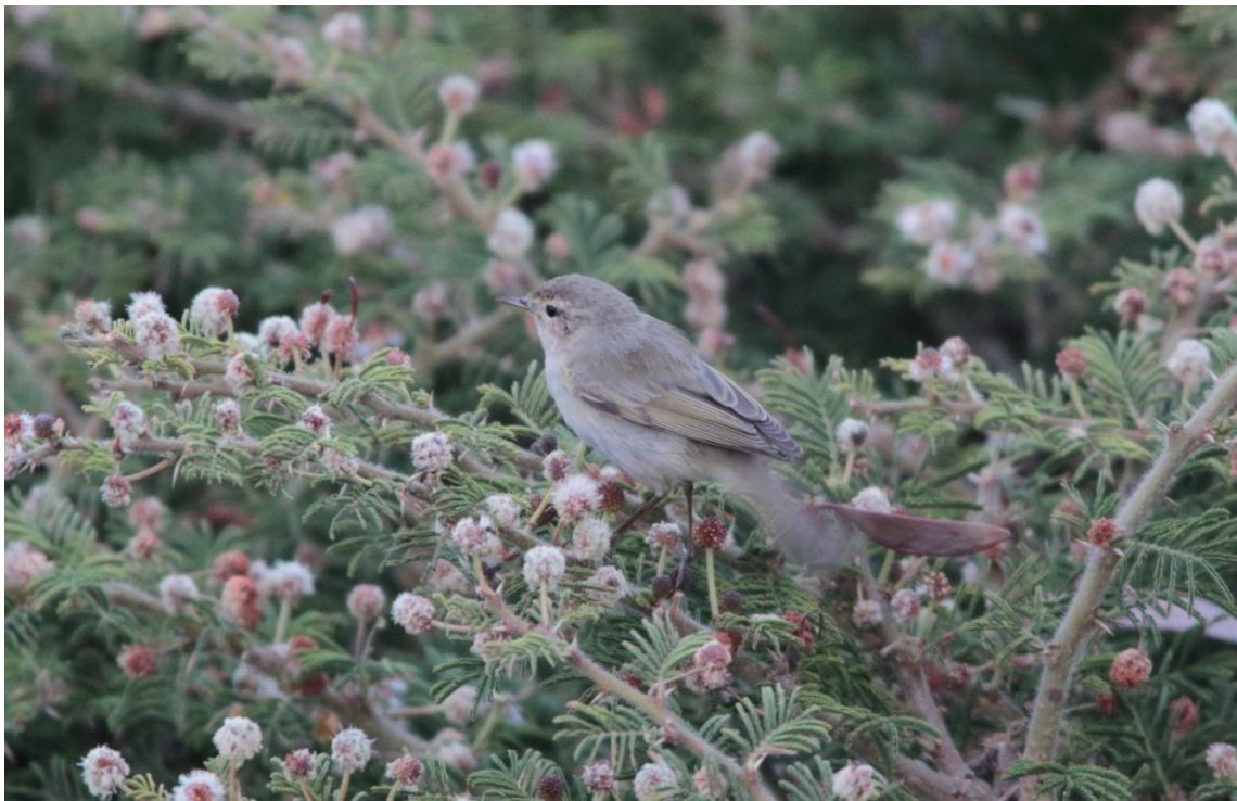
Common Chiffchaff, Pouillot véloce