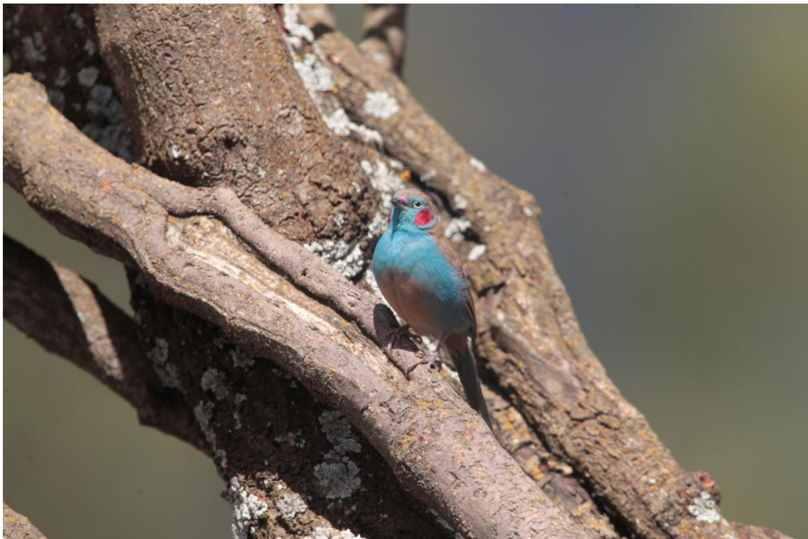
Red-cheeked Cordon-bleu, Cordon-bleu à joues rouges mâle