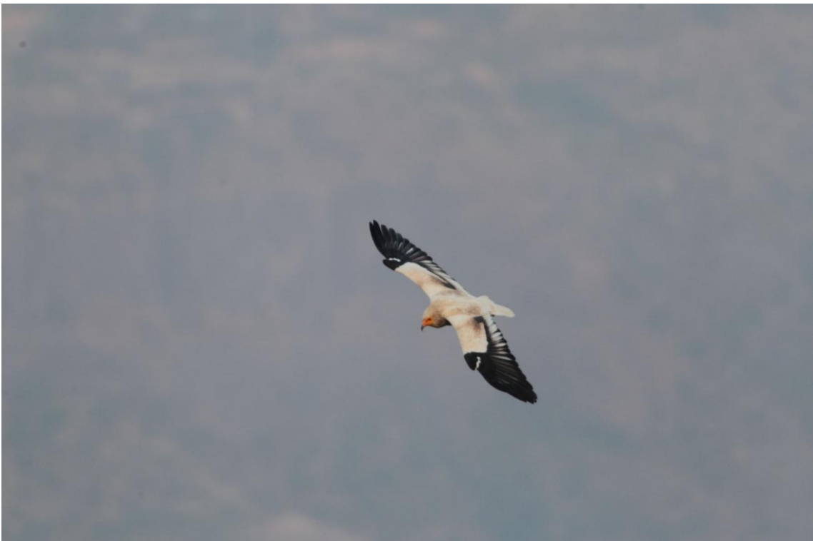
Egyptian Vulture, Percnoptère d'Égypte