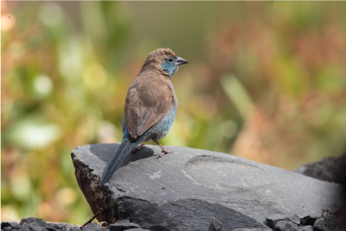
Red-cheeked Cordon-bleu, Cordon-bleu à joues rouges femelle