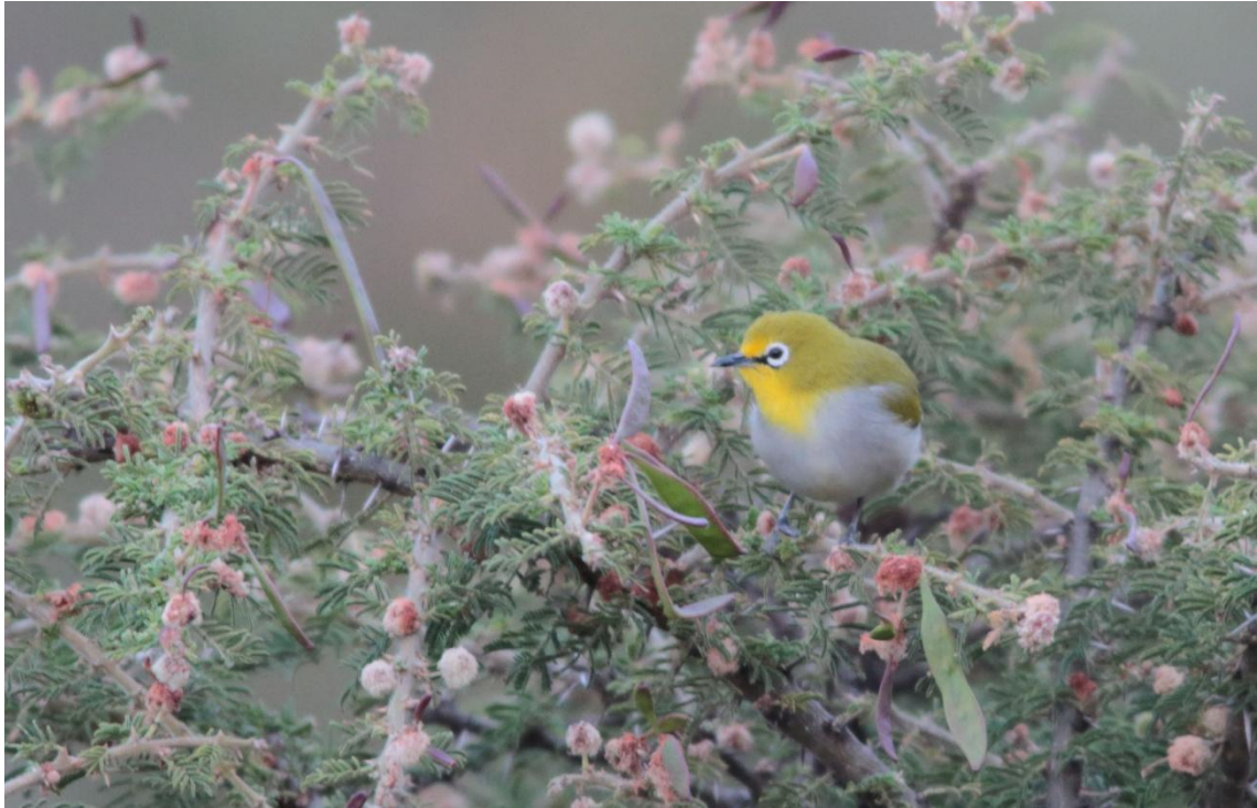
Montane White-eye, Zosterops alticole