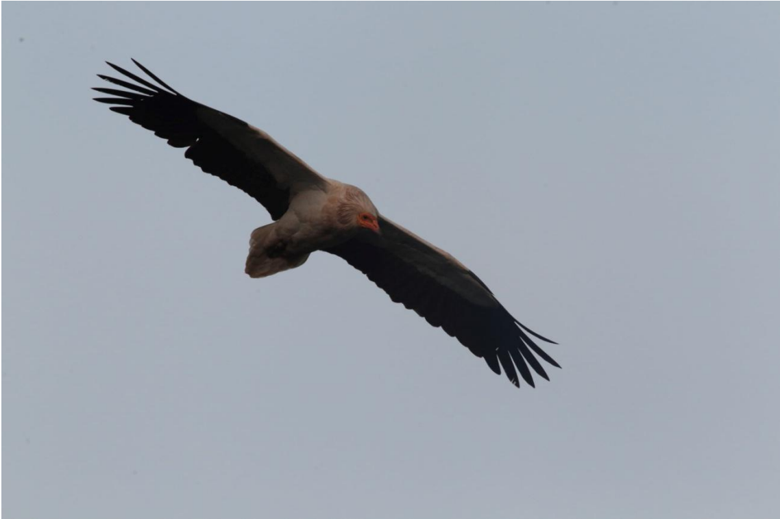
Egyptian Vulture, Percnoptère d'Égypte