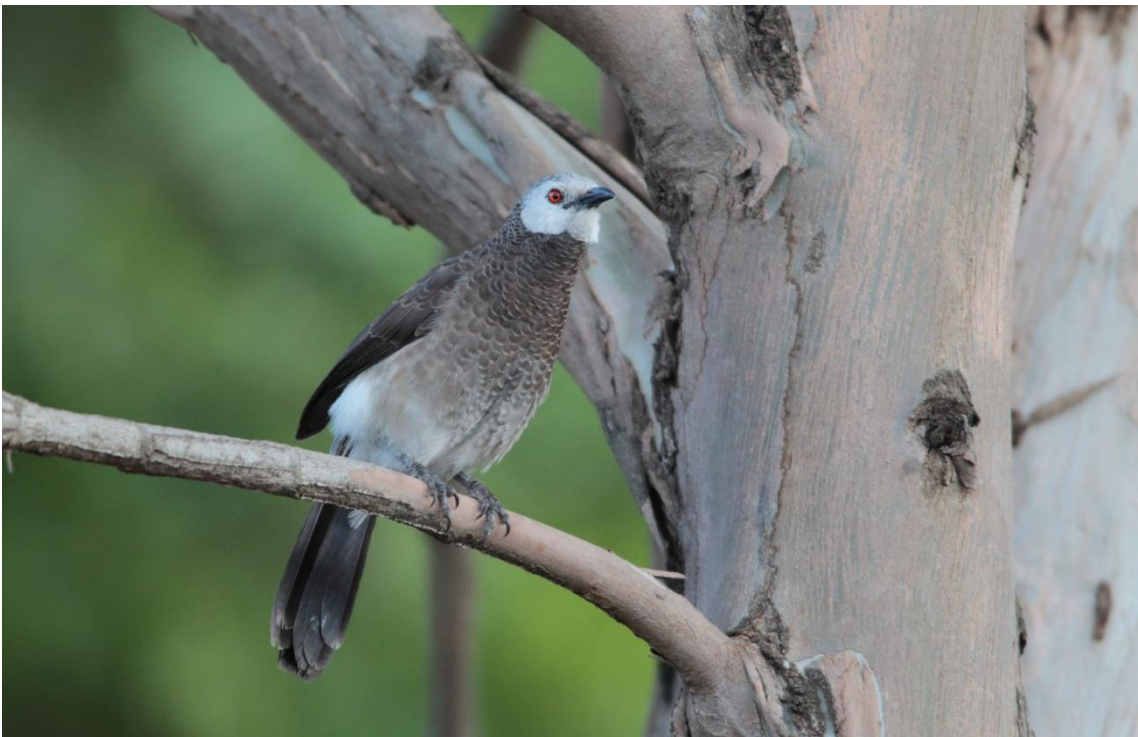
White-rumped Babbler limbata, Cratéropé à croupion blanc limbata