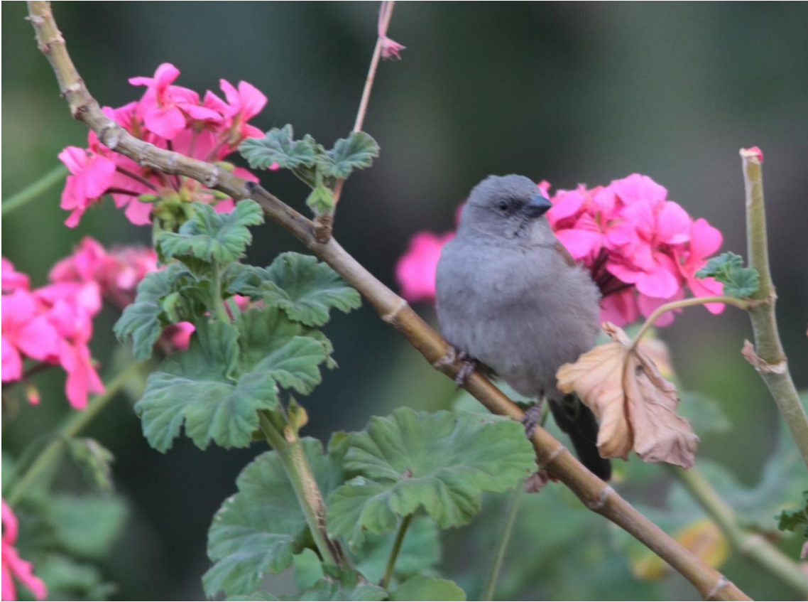
Swainson's Sparrow, Moineau de Swainson