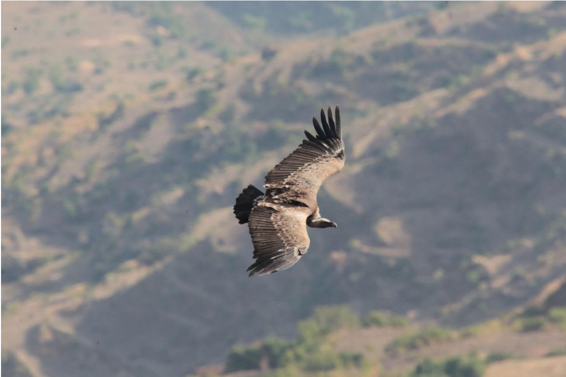
Rüppell's Vulture, Vautour de Rüpell