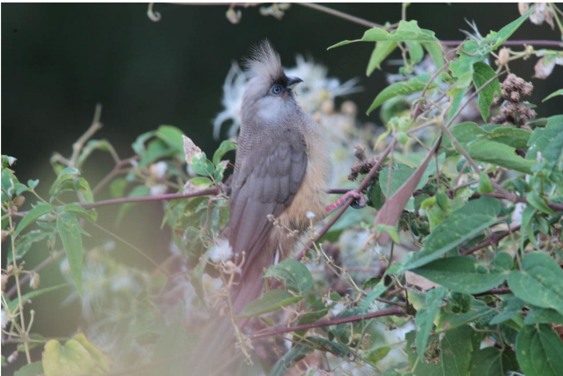
Speckled Mousebird, Coliou rayé