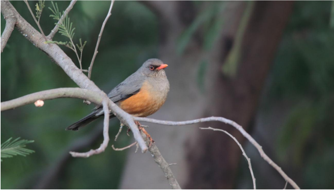
Mountain Thrush, Merle abyssinien