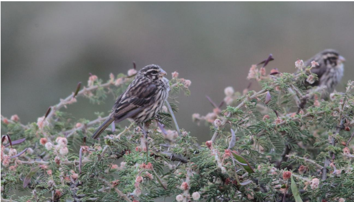
Streaky Seed-eater, Serin strié