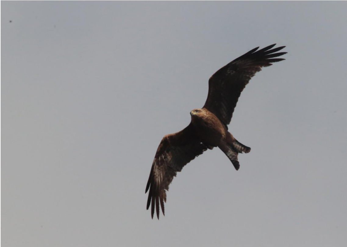
Yellow-billed Kite, Milan à bec jaune