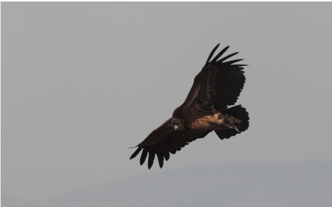
Rüppell's Vulture, Vautour de Rüpell