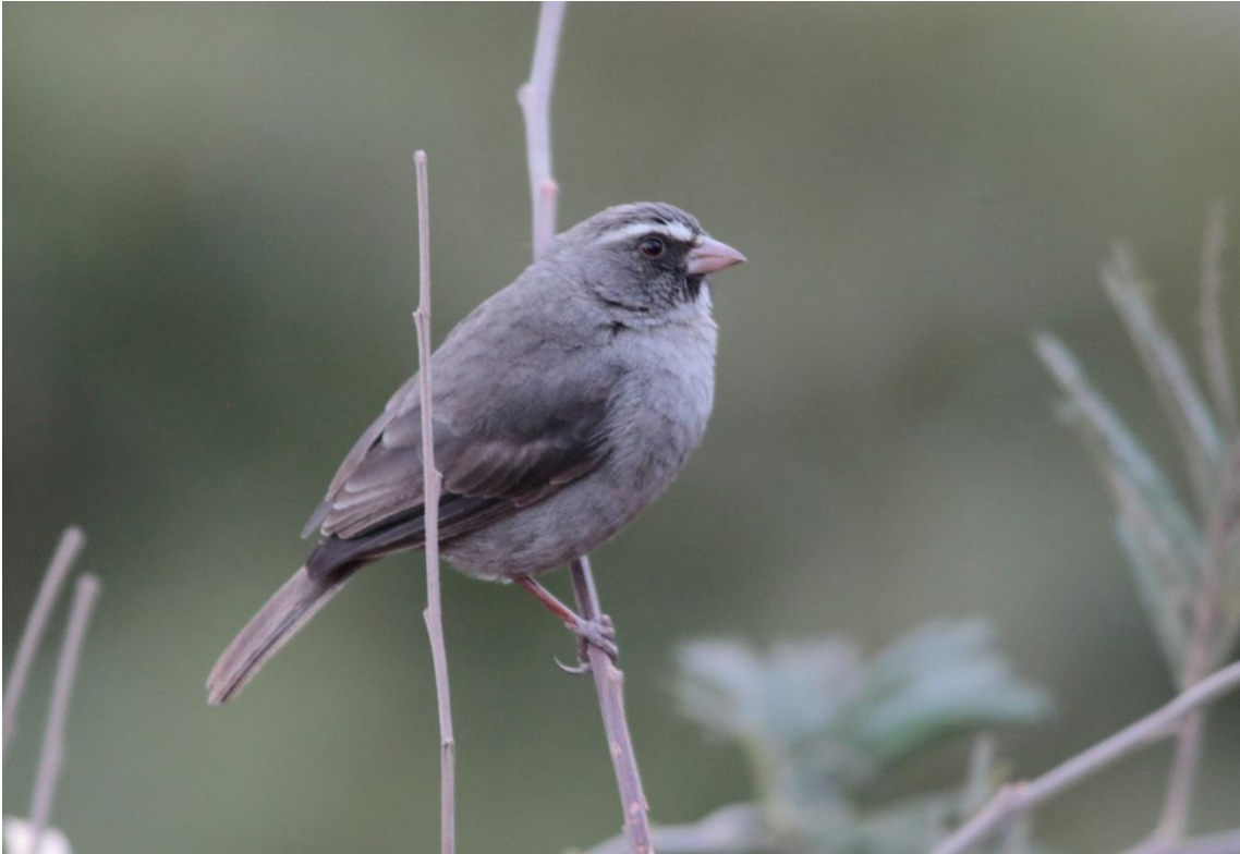
Brown-rumped Seedeater, Serin à 3 raies