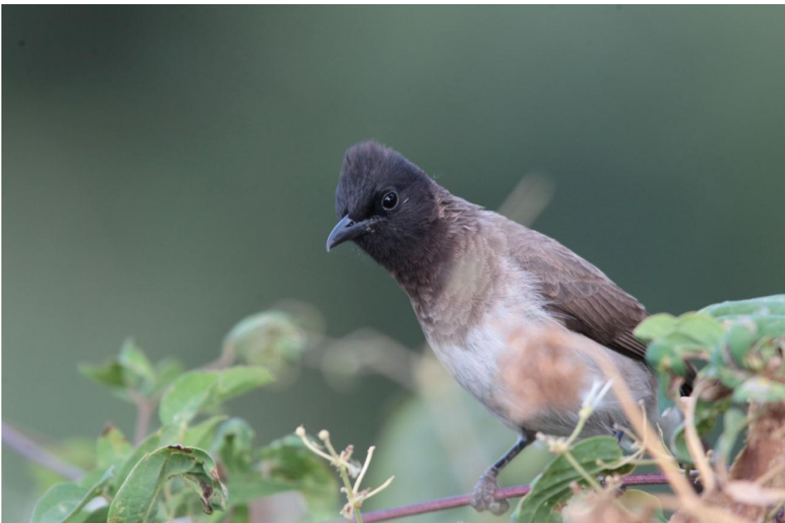
Common bulbul, Bulbul des jardins