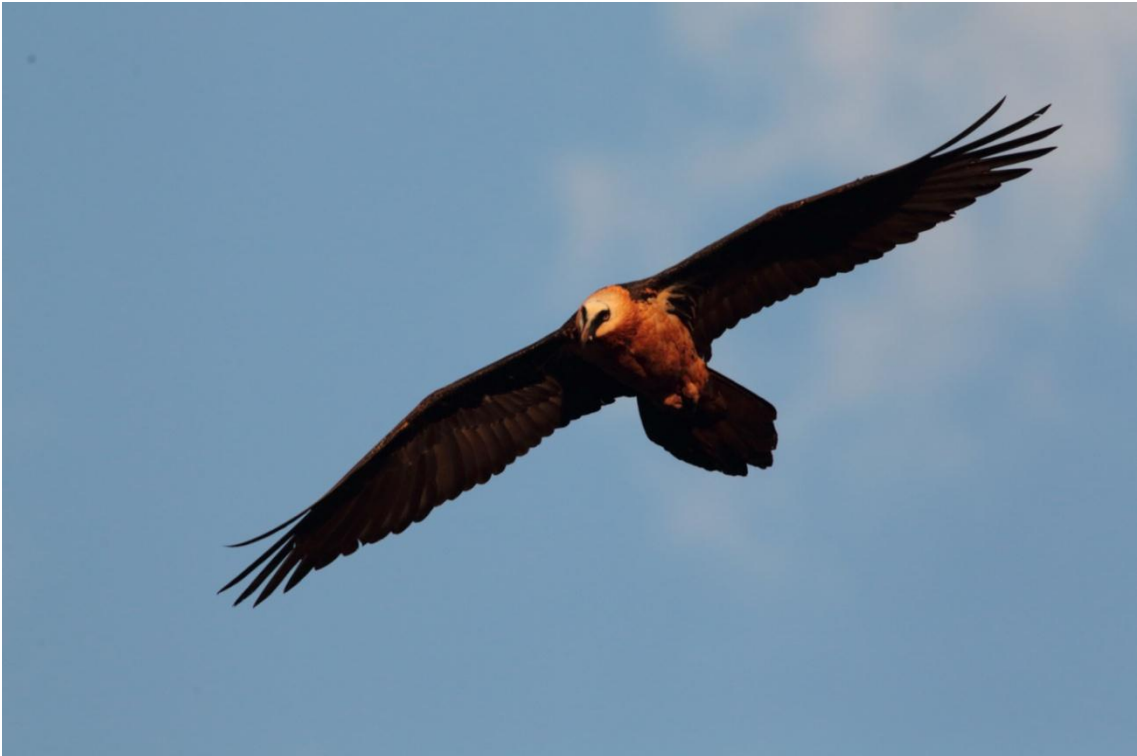
Lammergeier, Gypaète barbu