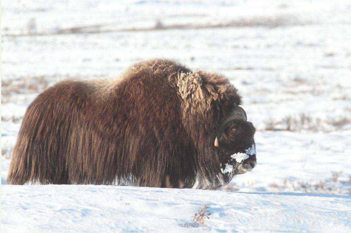
724 - Bœuf musqué