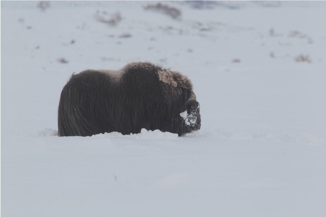
714 - Bœuf musqué