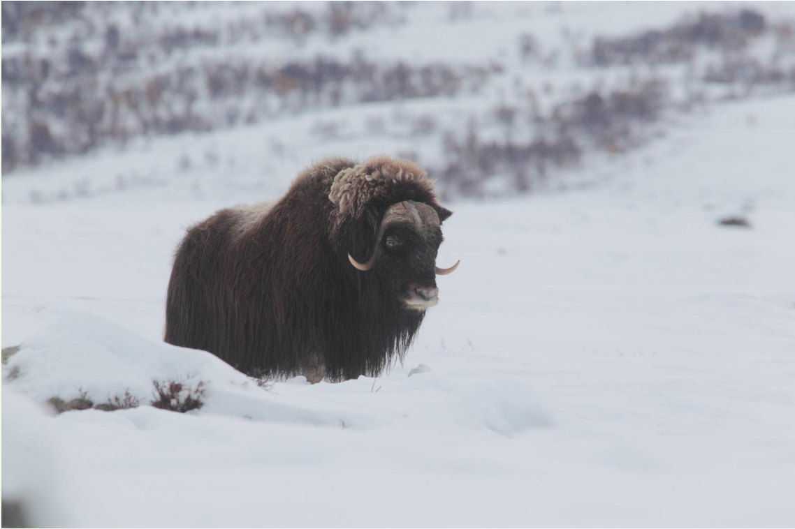
716 - Bœuf musqué