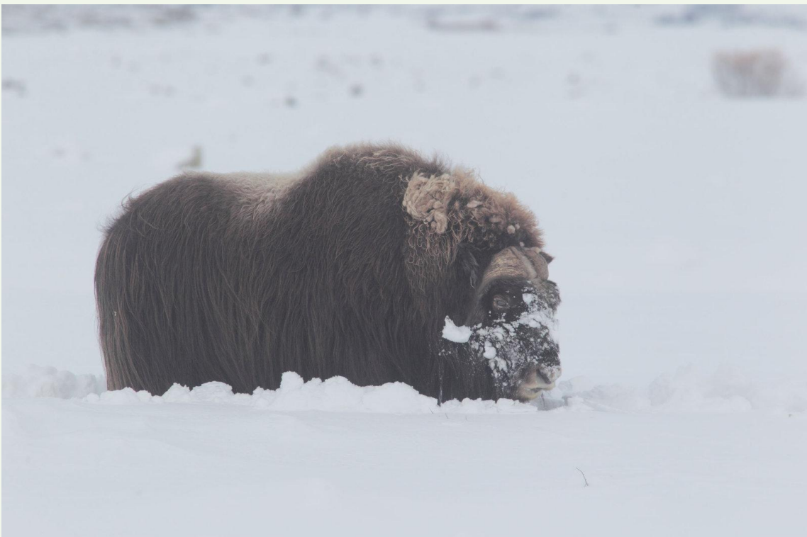
715 - Bœuf musqué