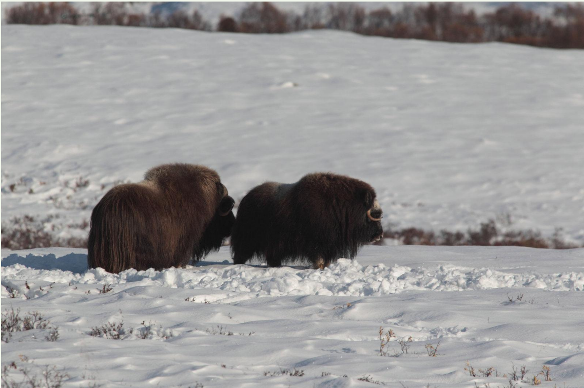
719 - Bœuf musqué