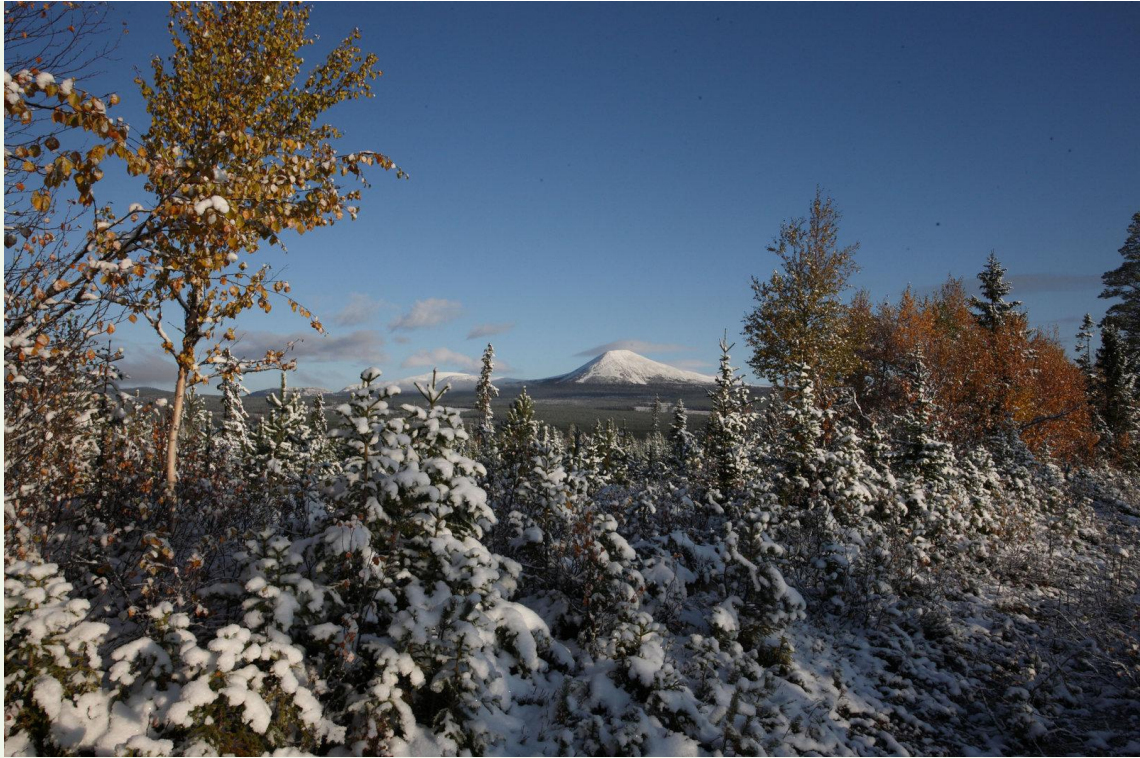
726 - Sanfjallet