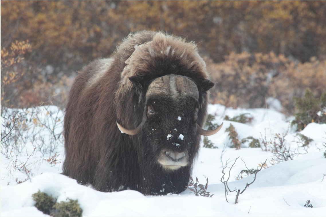
718 - Bœuf musqué