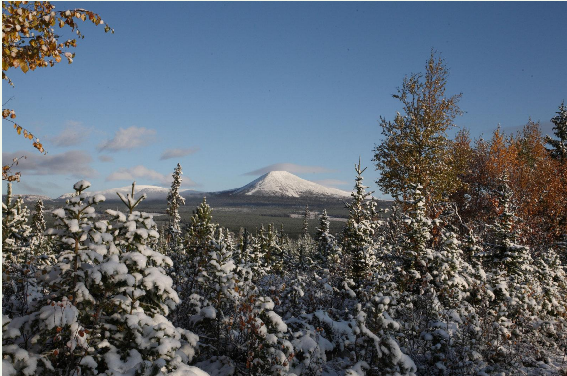
727 - Sanfjallet