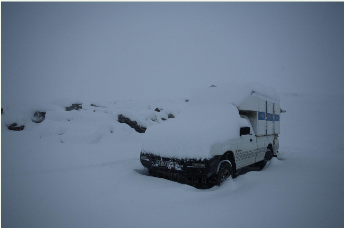
725 - Mon Mitsubishi sous la neige le matin du 2 octobre