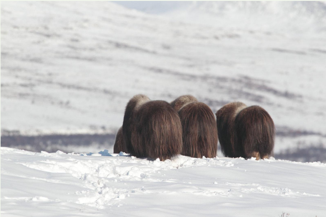
723 - Bœuf musqué