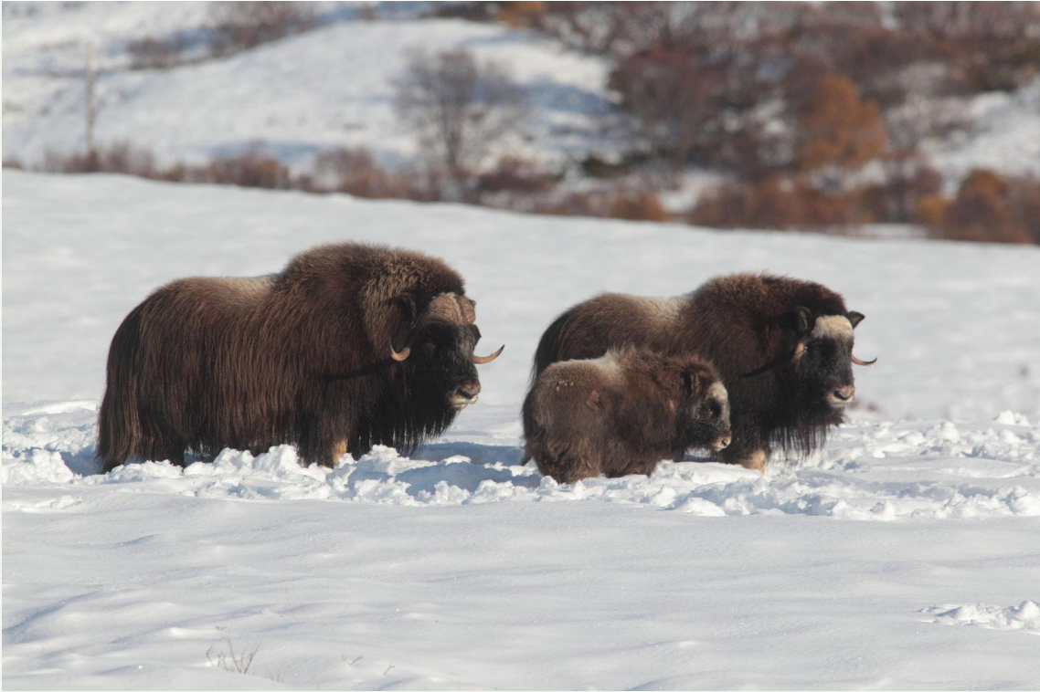
720 - Bœuf musqué