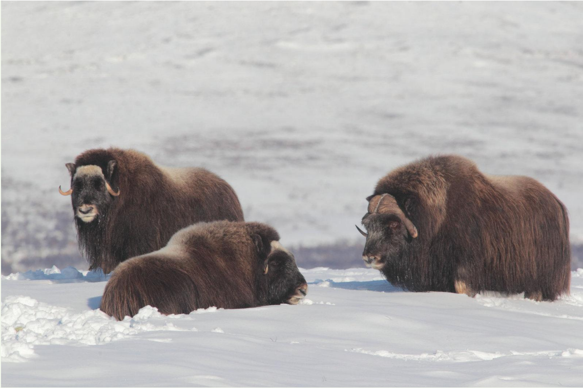
722 - Bœuf musqué