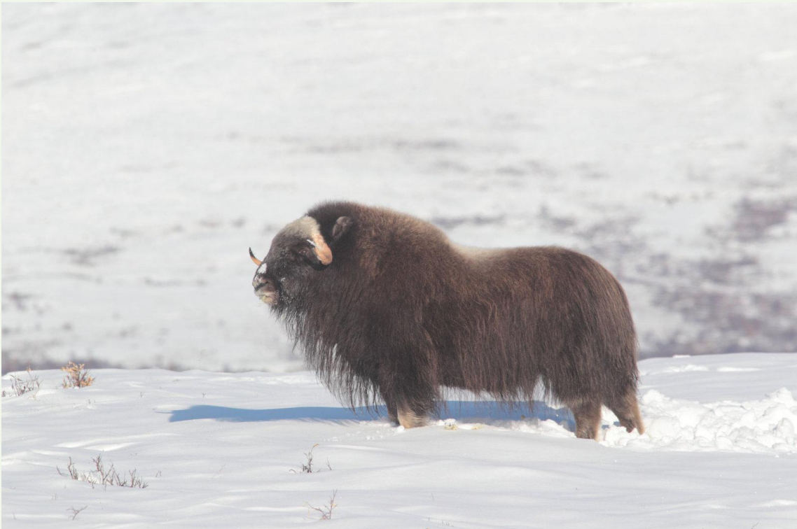
721 - Bœuf musqué