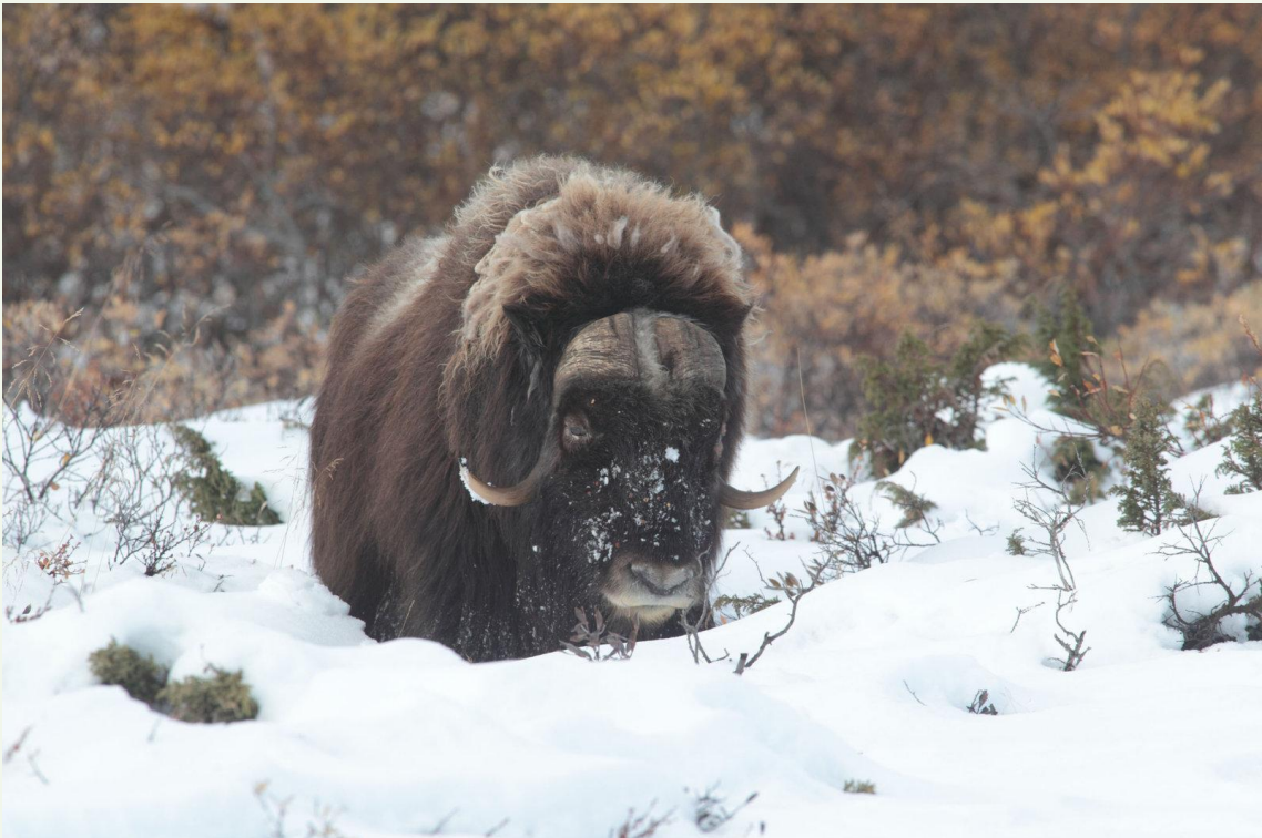
717 - Bœuf musqué