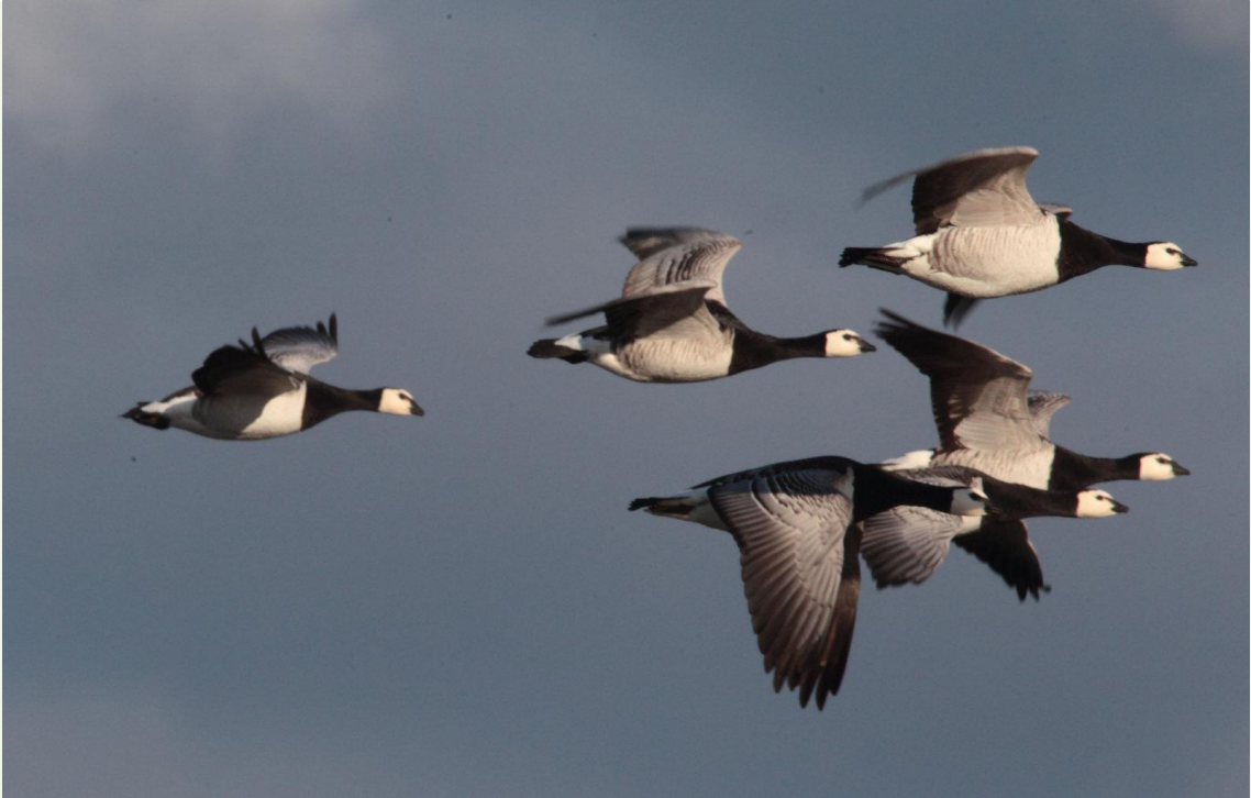
209 - Bernache nonnette