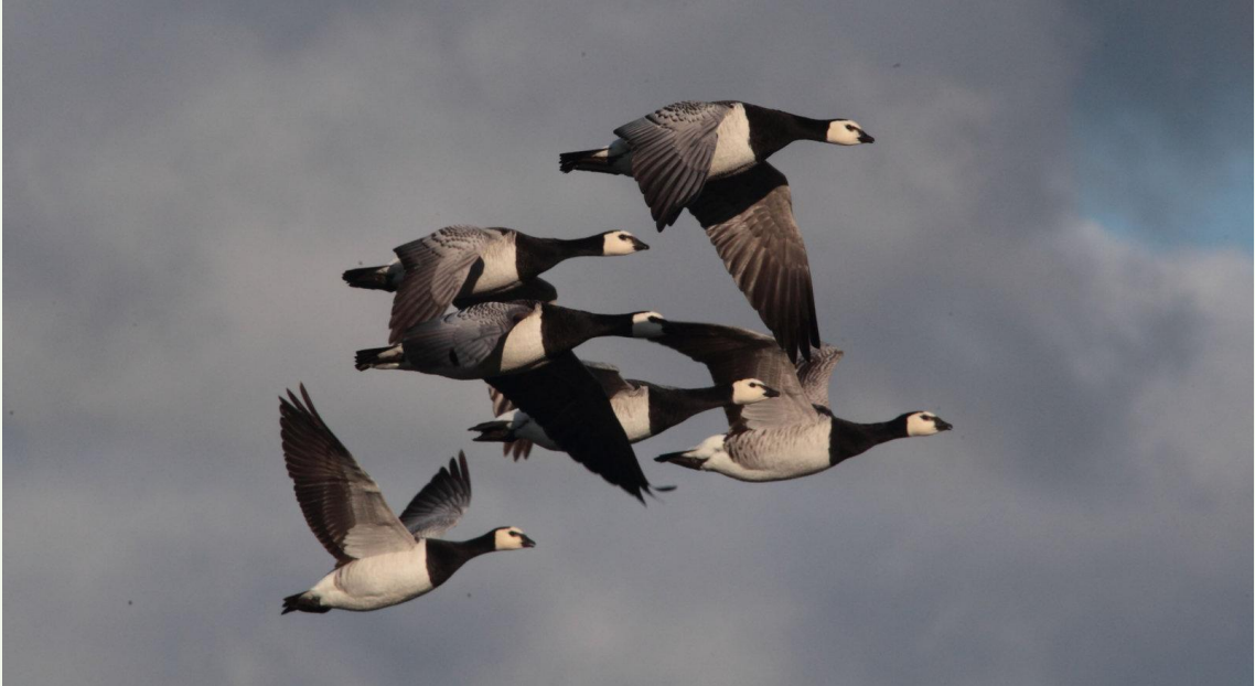
207 - Bernache nonnette