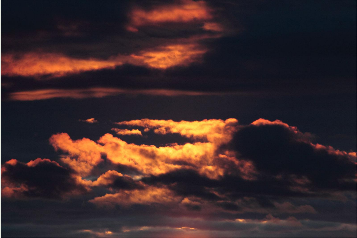
219 - Coucher de soleil