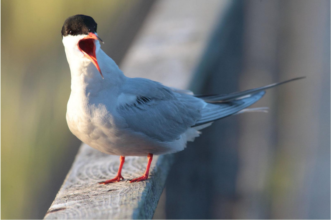
215 - Sterne arctique