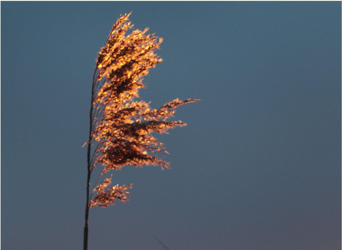
218 - Phragmite