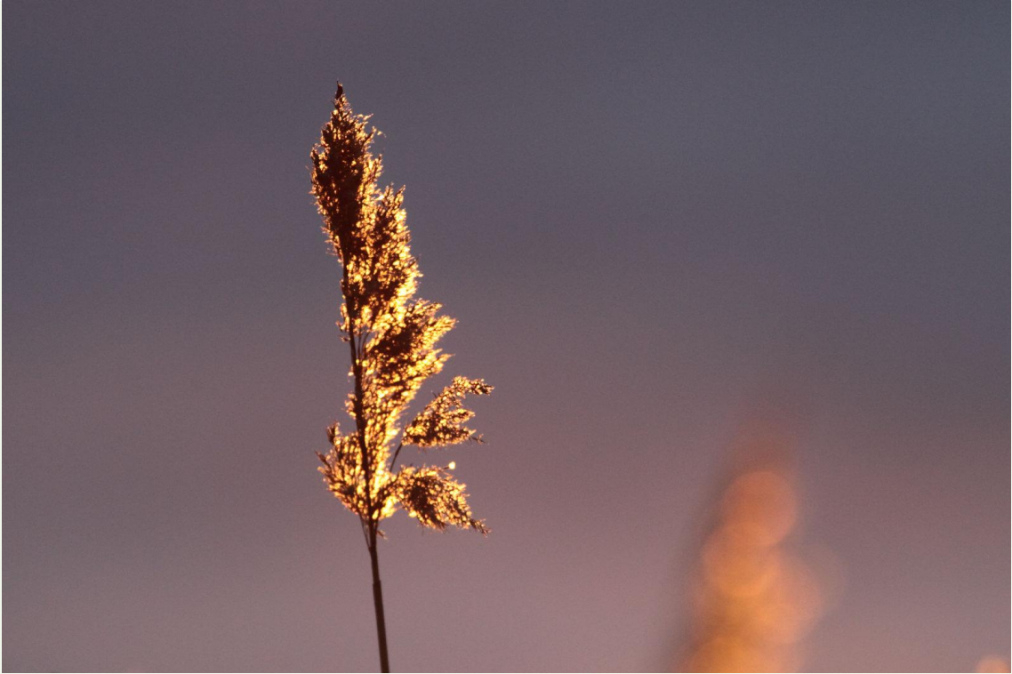
217 - Phragmite