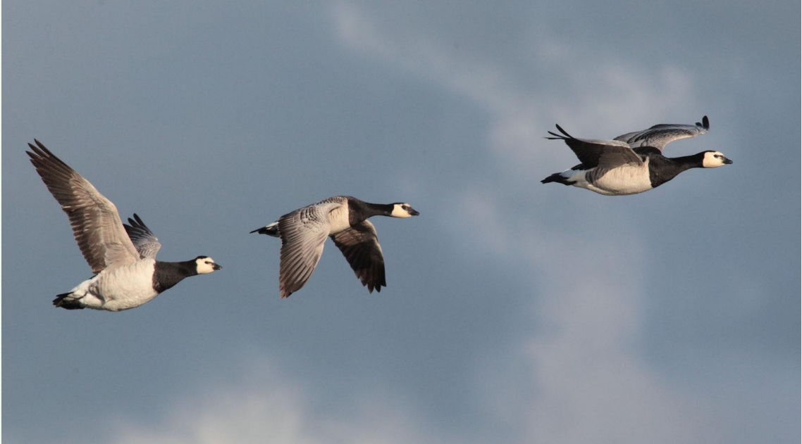
211 – Bernache nonnette