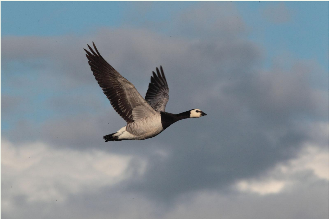
210 - Bernache nonnette