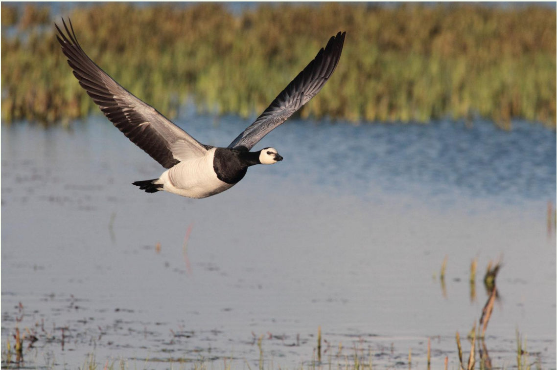
214 - Bernache nonnette