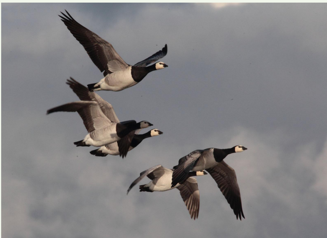
206 – Bernache nonnette