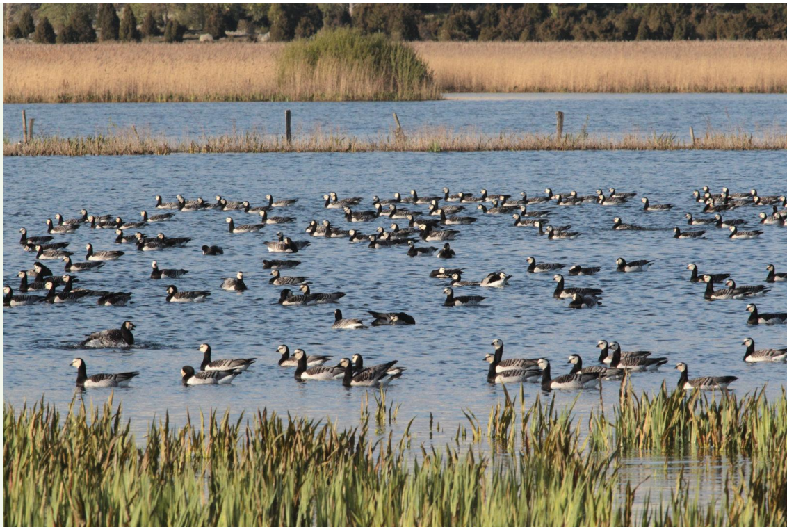
205 – Bernache nonnette