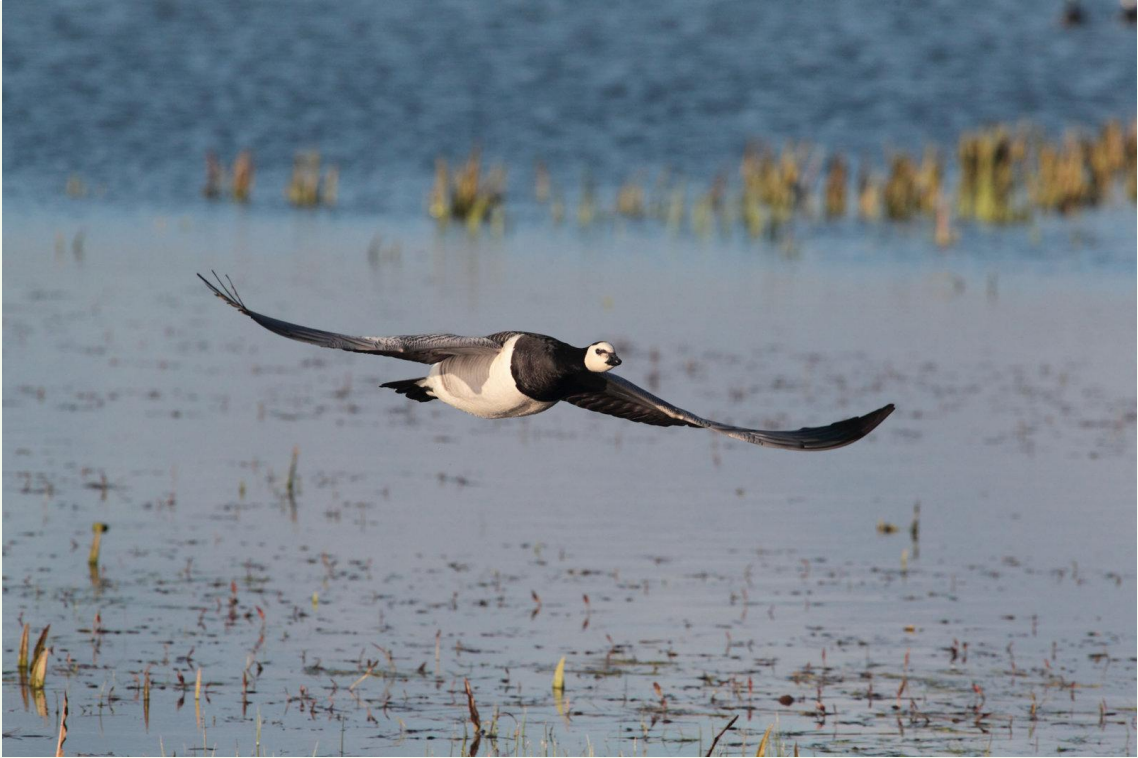
213 - Bernache nonnette