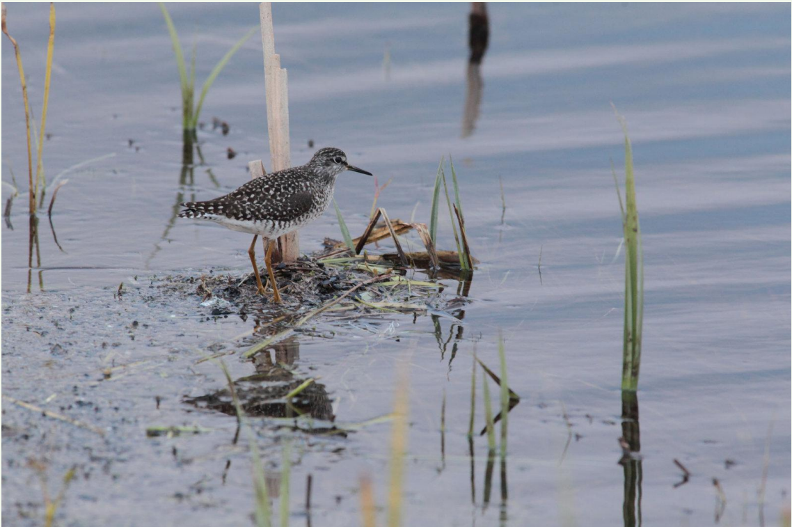
216 - Chevalier sylvain