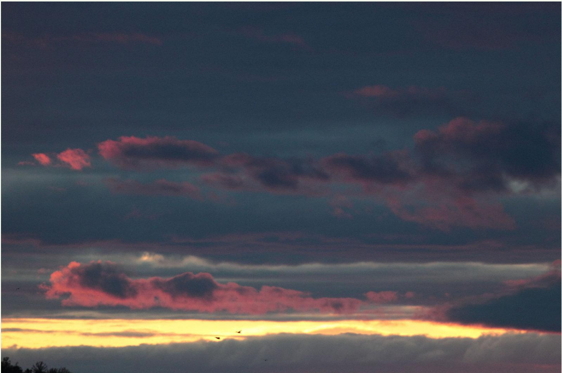
220 - Coucher de soleil