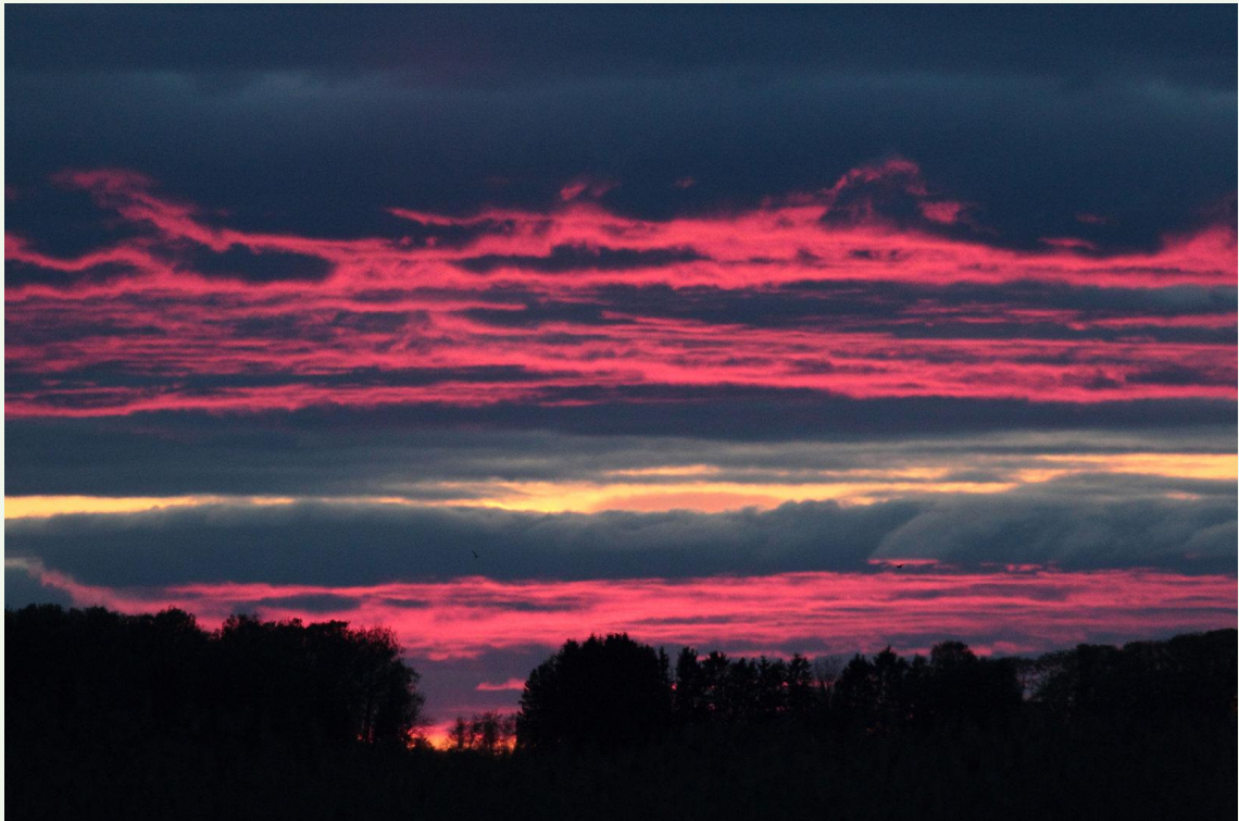
222 - Coucher de soleil