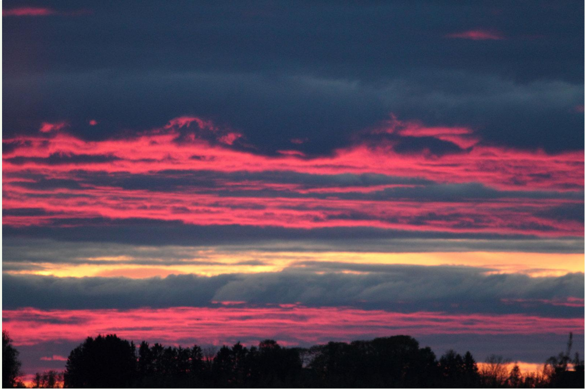
221 - Coucher de soleil