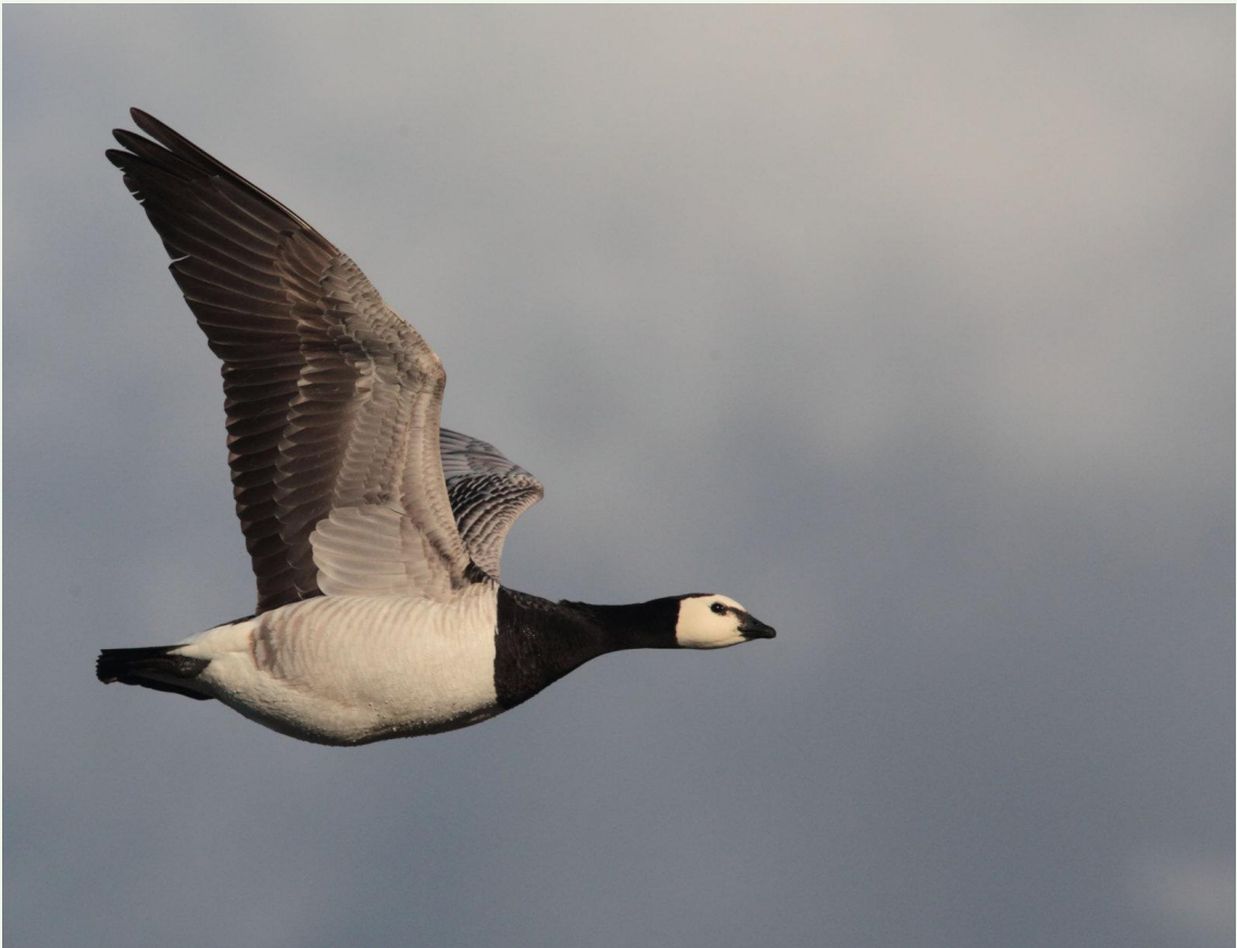
212 – Bernache nonnette