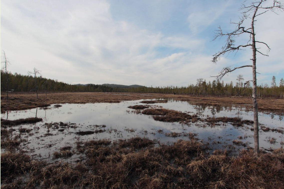
105 - Tourbière où paradent les Tétrás-lyre

Après le grand Tétrás, place à son cousin le Tétrás-lyre. Tout d'abord quelques photos de la tourbière où je pose mon affût. Comme pour le grand Tétrás, je m'y installe dès le début de soirée vers 18h30-19h pour ne pas déranger les oiseaux qui très souvent viennent faire un tour le soir pendant 15 à 30 mns avant de se percher pour la nuit. Et les mâles commencent à chanter bien avant qu'il fasse jour et c'est évidemment un réel plaisir de les entendre avant de les observer. Et ensuite quelques photos des mâles. Les 1ères nuits tout début mai, la tourbière était gelée et les oiseaux paraissent sur l'eau, puis cela a fondu et les oiseaux se sont rapprochés de l'affût. Enfin, les 2 dernières nuits, il a neigé un peu. Bonne journée Jean-Marc