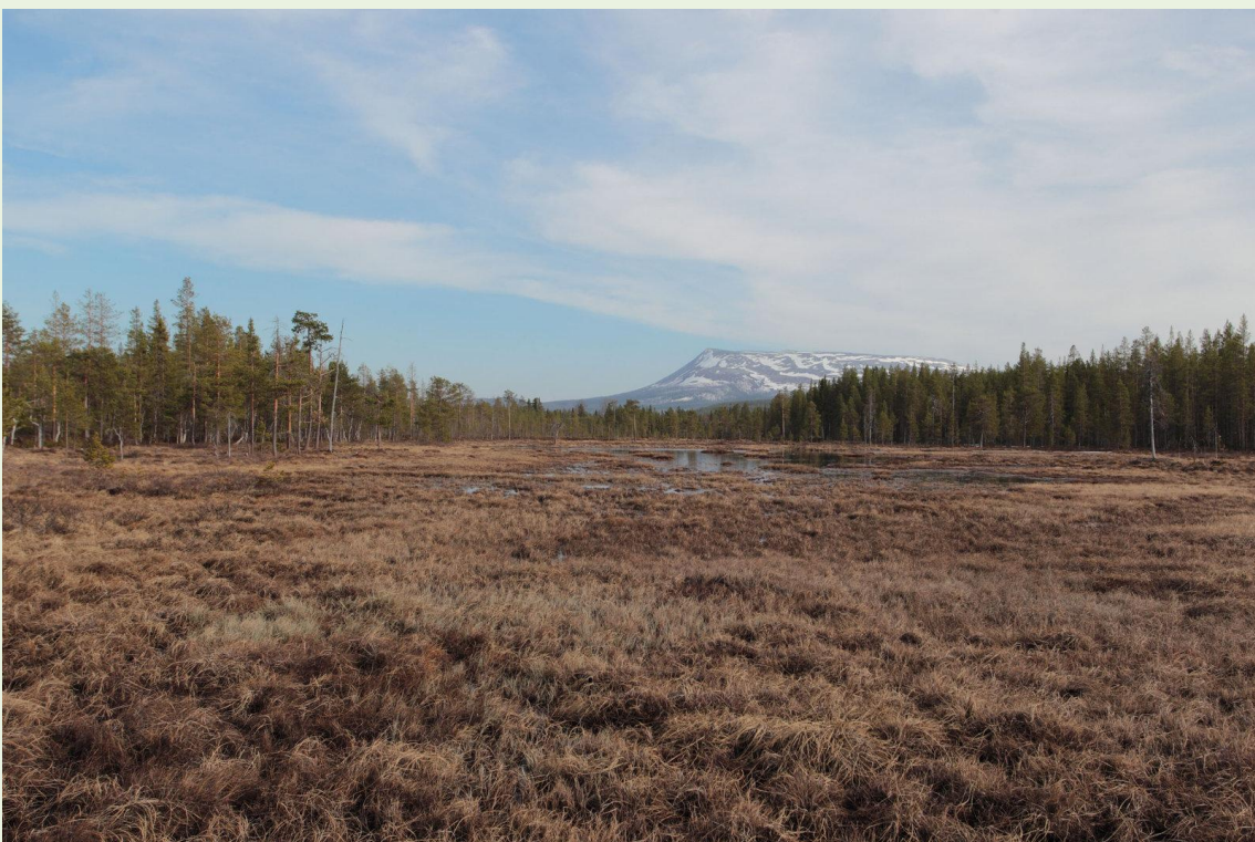
106 - Tourbière où paradent les Tétrás-lyre