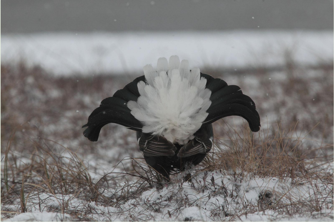
129 - Mâle de Tétras-lyre en parade