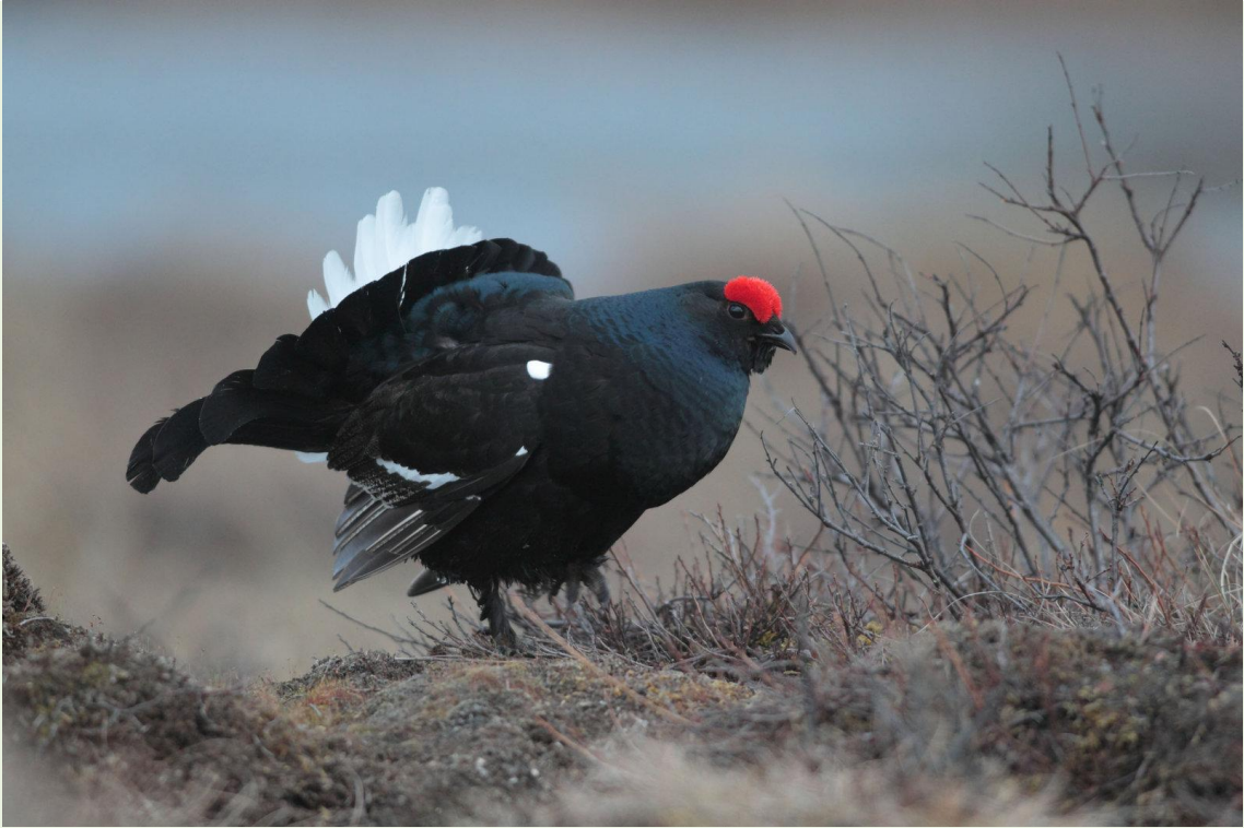
113 - Mâle de Tétras-lyre en parade