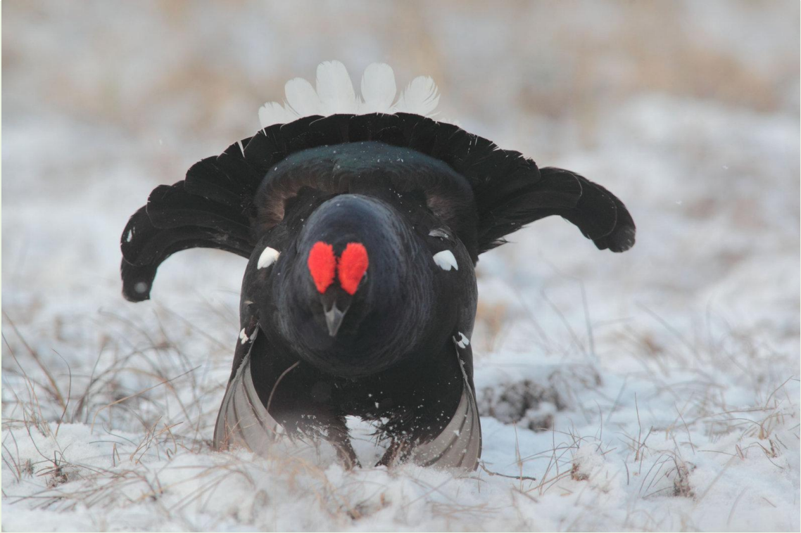
121 - Mâle de Tétras-lyre en parade