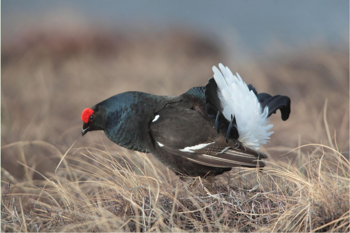
125 - Mâle de Tétras-lyre en parade