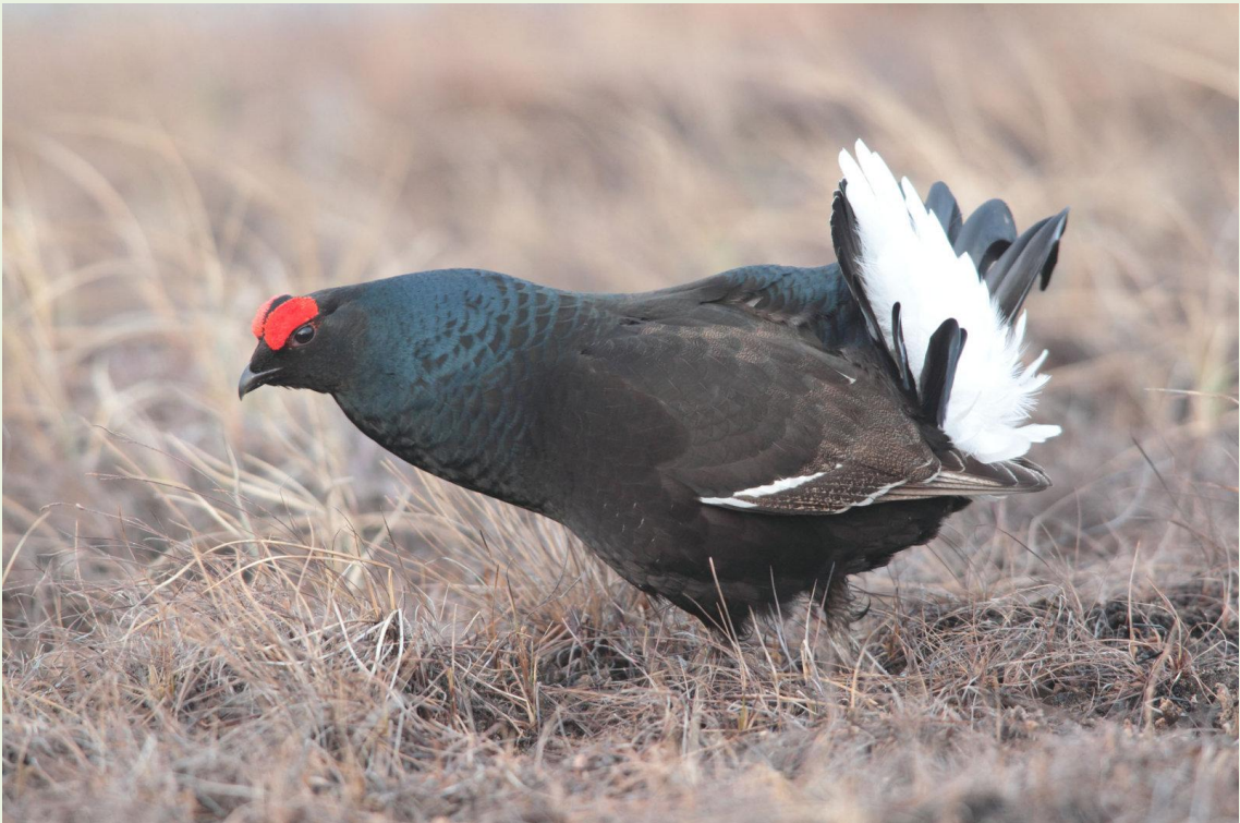
114 - Mâle de Tétras-lyre en parade