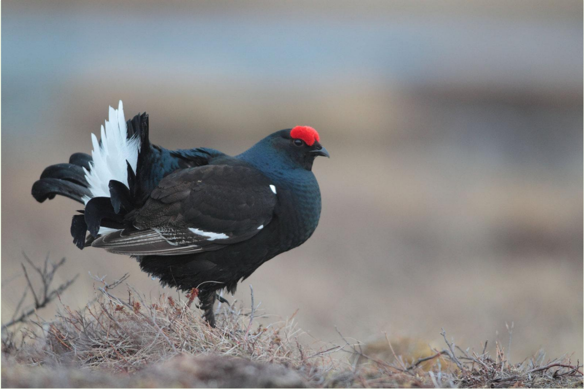
115 - Mâle de Tétras-lyre en parade