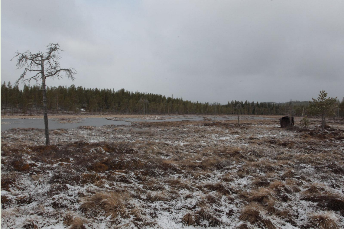
107 - Tourbière où parquent les Tétrasyre avec l'affût en place