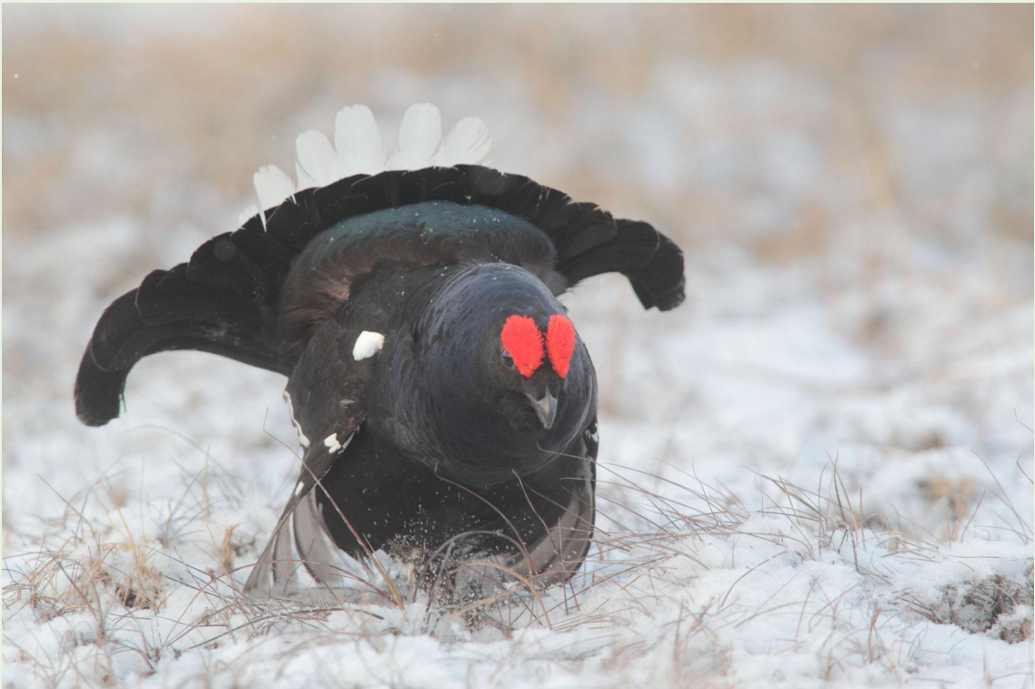
120 - Mâle de Tétras-lyre en parade