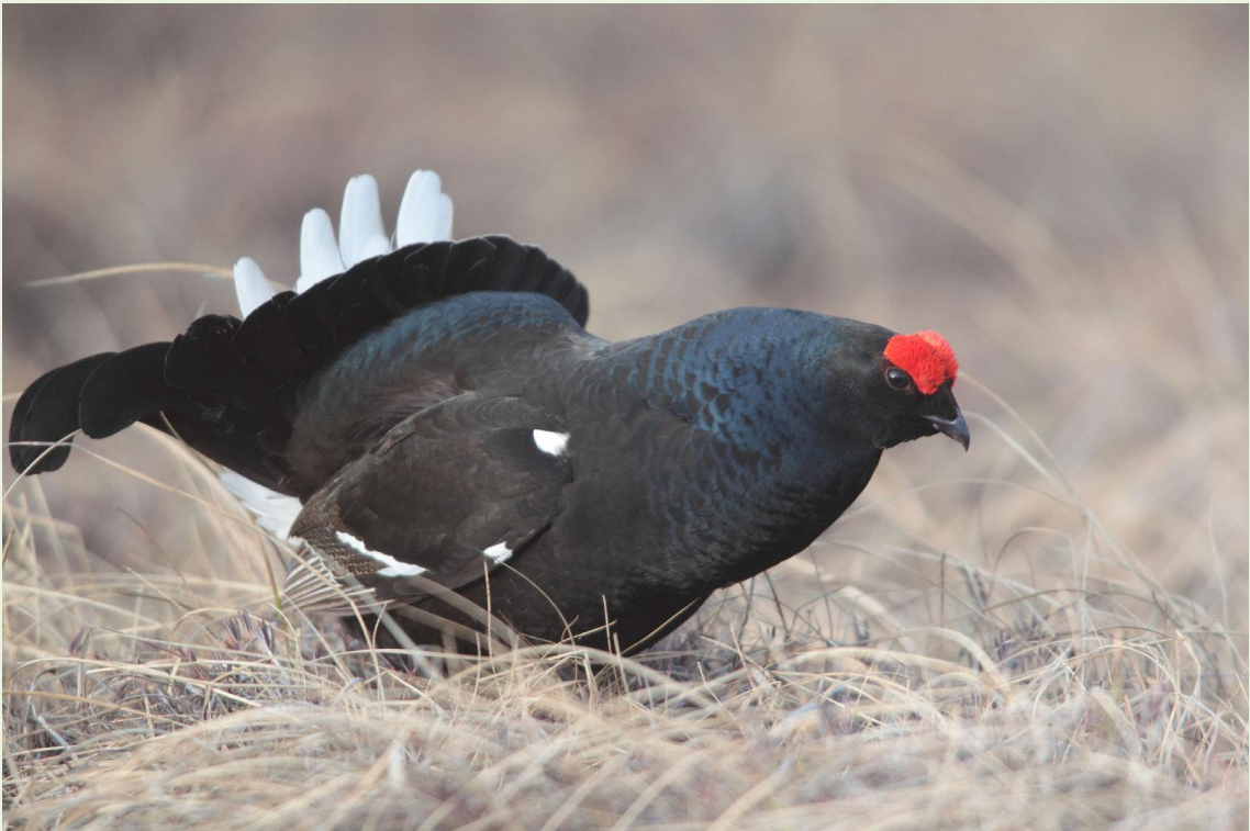
124 - Mâle de Tétras-lyre en parade