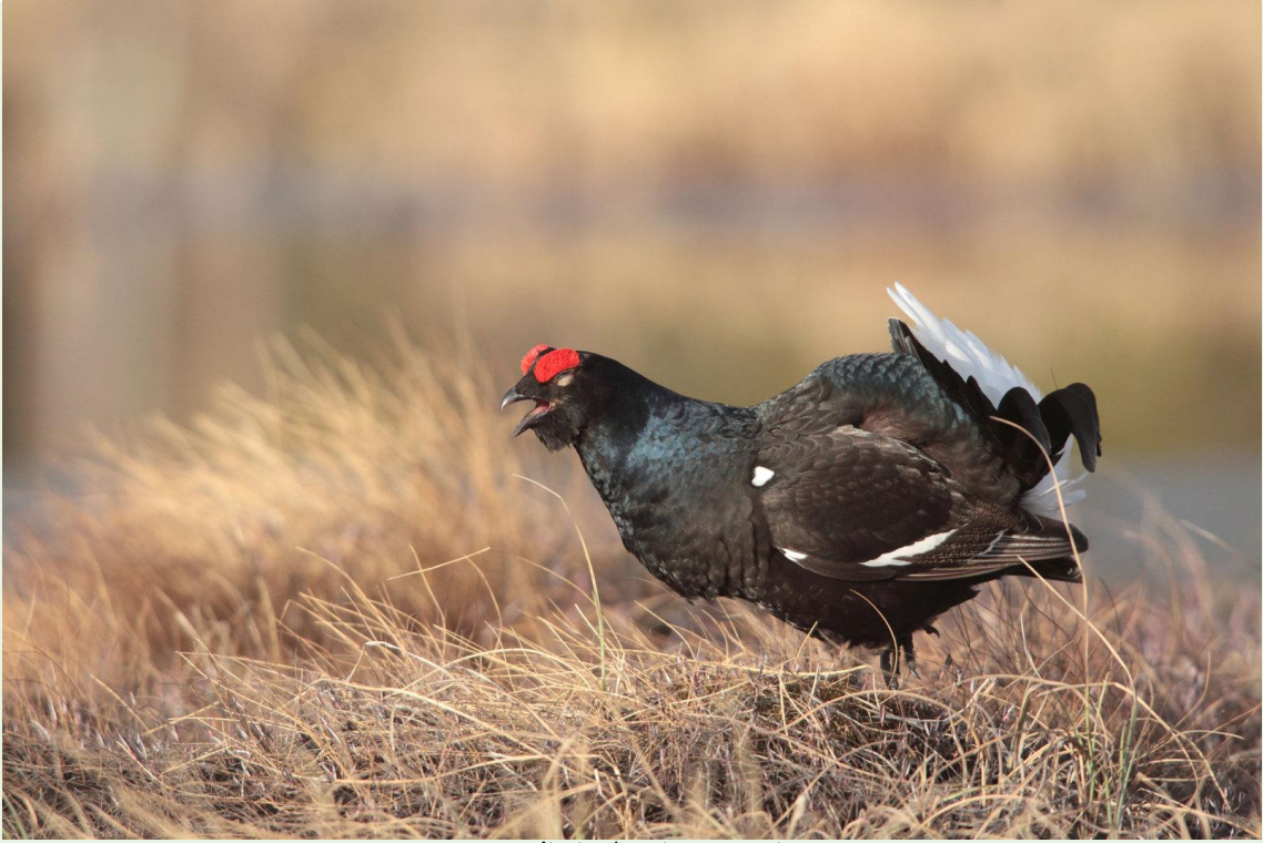
127 - Mâle de Tétras-lyre en parade