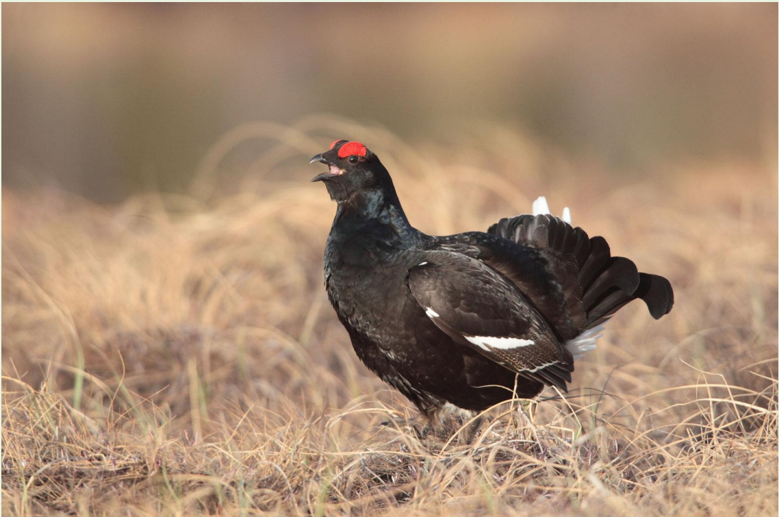
126 - Mâle de Tétras-lyre en parade