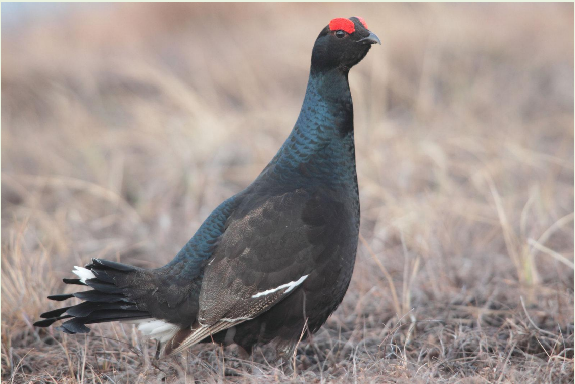
112 - Mâle juvénile de Tétras-lyre en "visite"