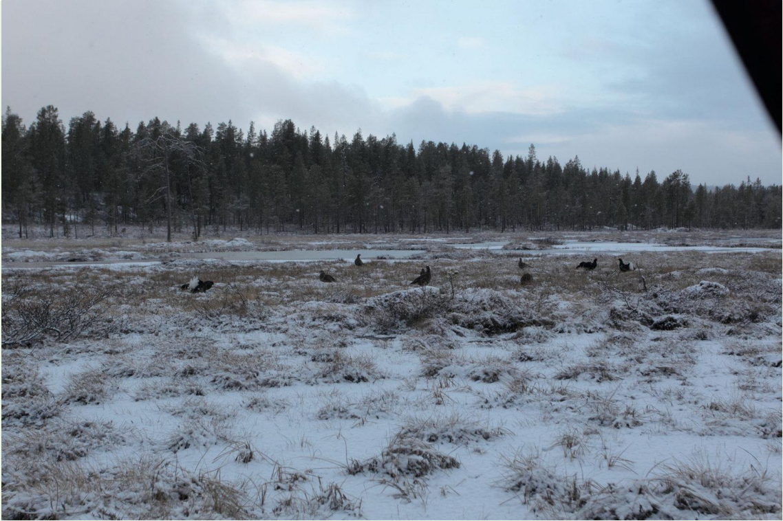
109 - Les Tétrasyre parquent