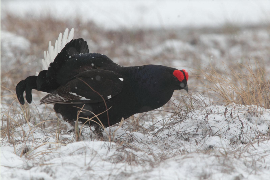
123 - Mâle de Tétras-lyre en parade