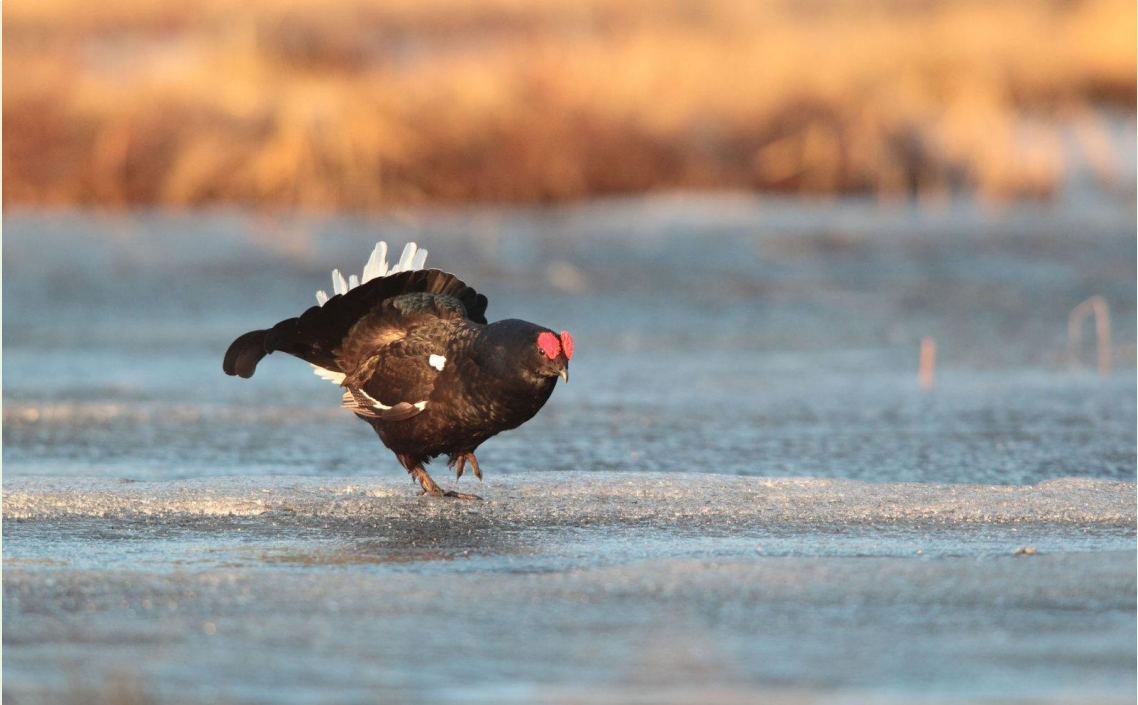
111 - Mâle de Tétras-lyre en parade