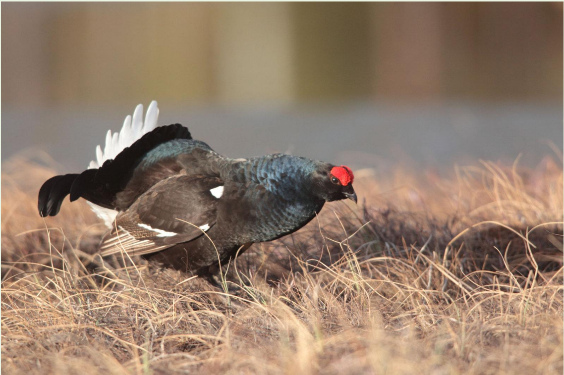
128 - Mâle de Tétras-lyre en parade