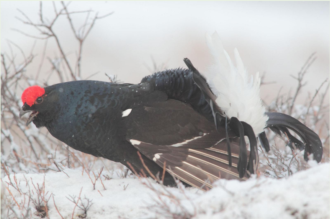
118 - Mâle de Tétras-lyre en parade