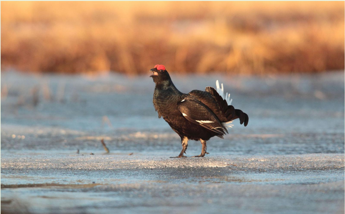
110 - Mâle de Tétrasyre en parade