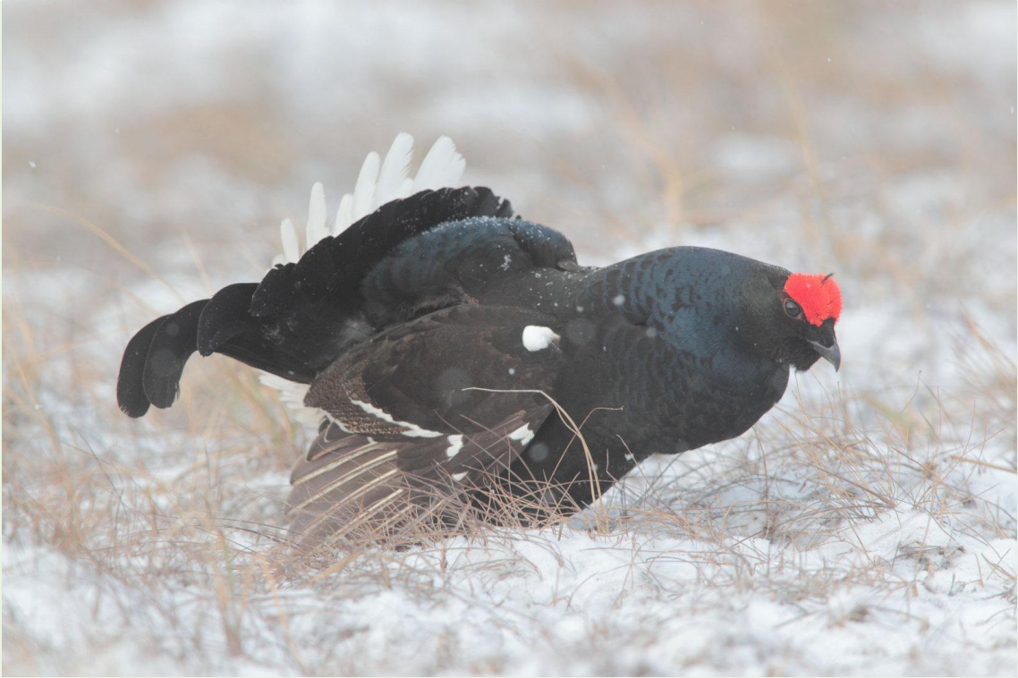
119 - Mâle de Tétras-lyre en parade