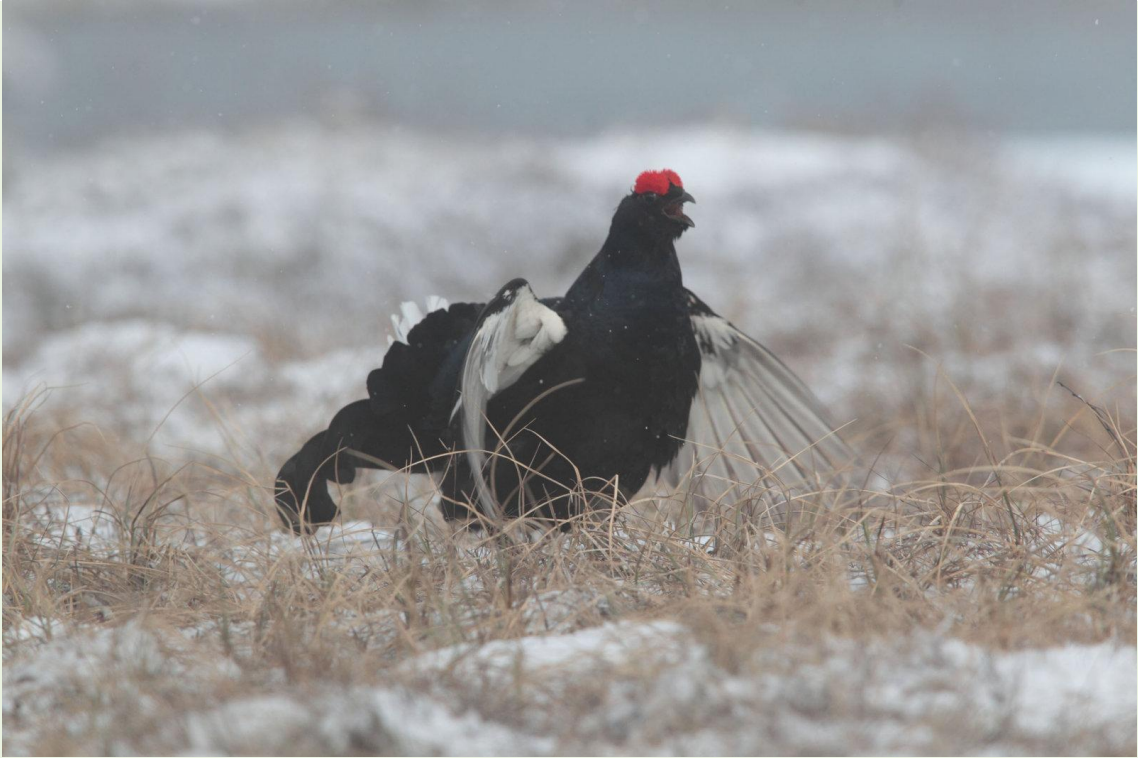
117 - Mâle de Tétras-lyre en parade