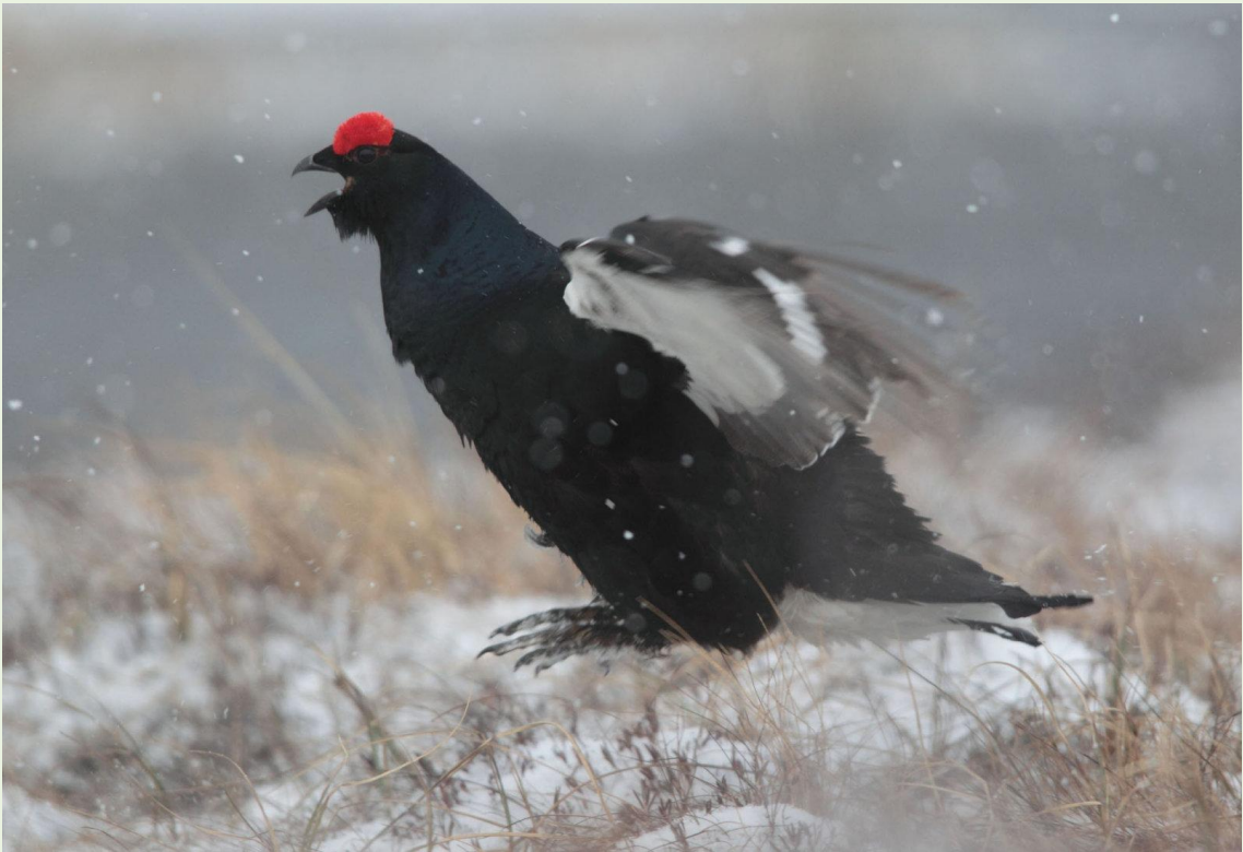
122 - Mâle de Tétras-lyre en parade