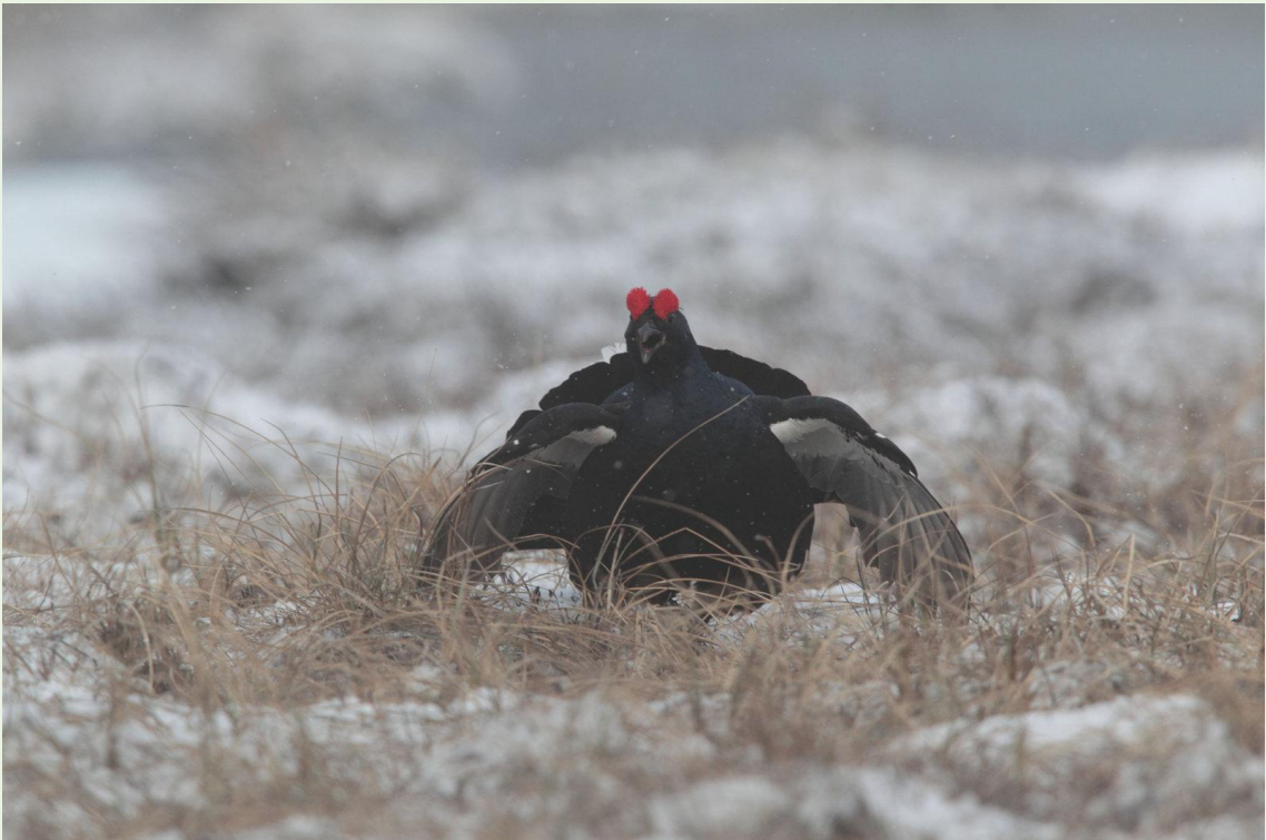
116 - Mâle de Tétras-lyre en parade